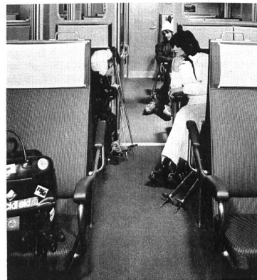
Luzern-Stans-Engelberg-Bahn Chemin de fer Lucerne-Stans-Engelberg Luzern-Stans-Engelberg Railway Ferrovia Lucerna-Stans-Engelberg

Les autorités scolaires, les compagnies de chemins de fer et de navigation ont pu se rendre compte des avantages précités et d'autres encore. La Compagnie de navigation sur le lac des Quatre-Cantons a fait poser un tapis de Nylsuisse® dans le restaurant de son nouveau bateau, le « Gotthard », le Chemin de fer Lucerne-Stans-Engelberg a fait garnir les compartiments de première classe de ses nouveaux wagons de tapis, comme l'Ecole normale Rothen, près Lucerne, en a fait poser dans les chambres des maîtres, les salles de séances et de classe, sans oublier la bibliothèque. Et, depuis quelques jours, un tapis de Nylsuisse® orne la grande salle de séances du Palais fédéral à Berne, tapis tissé à la Fabrique de tapis de Melchnau S.A. , et dont la Société de la Viscose Suisse à Emmenbrücke a fait présent au gouvernement helvétique.