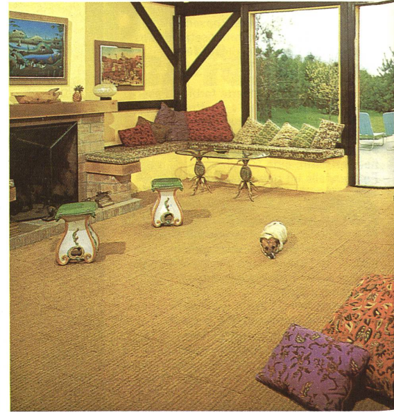
Tahiti in Platten von 50 x 50 cm mit Waffelrücken. Tahiti en plaques de 50 x 50 cm, avec dessous gaufré. Tahiti in 50 x 50 cm squares with honeycomb backs. Tahiti in lastre da 50 x 50 cm, con rovescio a nido d'api.