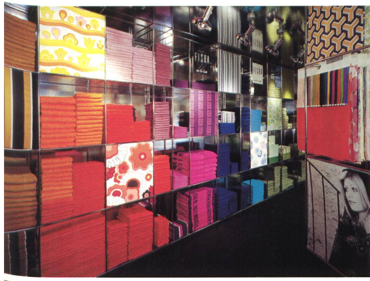
FISBA-St. Gallen Verkaufsraum / salon de présentation / showroom / locale di vendita

trois rangs des rideaux en miniature. L'inclusion des dessins imprimés et jacquard dans le programme «Fixhang» rendit cette formule caduque, car on ne pouvait y exposer des dessins à grand rapport dans toute leur longueur pour démontrer l'effet produit; c'est pourquoi les nouvelles installations ne comprennent aujourd'hui que deux rangées d'échantillons. Par suite de l'augmentation continue de l'offre — la collection comprend actuellement plus de 500 dessins et coloris — des installations murales de 16 mètres de long et même plus ne sont pas rares dans les magasins où l'on désire offrir l'assortiment complet. Mais comme peu de magasins de vente disposent d'assez de place pour cela, on a de nouveau cherché une forme de présentation plus pratique.