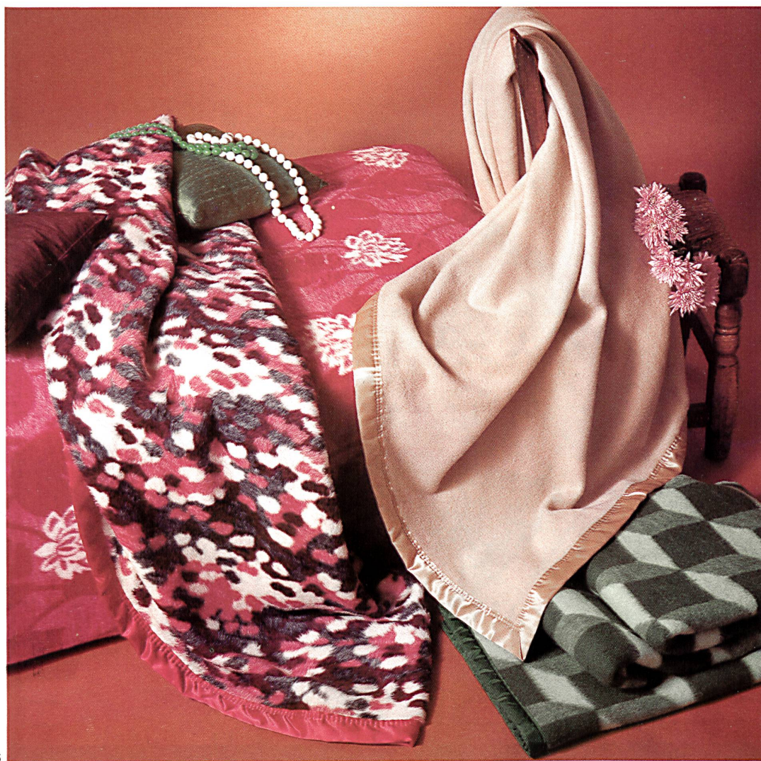
SCHWEIZERISCHE DECKEN- UND TUCHFABRIKEN AG, PFUNGEN

Die dynamische Geschäftsleitung beurteilt die Zukunft optimistisch. Dank der aussergewöhnlichen Qualitäten und dem modisch zeitgerechten Fabrikationsprogramm darf weiterhin mit einer weltweit guten Absatzmöglichkeit gerechnet werden. Der Verkaufsapparat ist nicht nur im Inland sondern auch in allen ausländischen Absatzgebieten ausgebaut worden, und man bemüht sich ständig, die Kontakte zur Kundschaft rege zu halten, um diese möglichst individuell und rasch ab Lager bedienen zu können. Das gross gefächerte Angebot enthält Schlafdecken in feinsten Schurwolle und in Orlon®, uni, double-face und mit Jacquard-Dessins, reine Kamelhaardecken in Sommer- und Winterqualitäten, Kamelhaardecken mit reiner Schurwolle gemischt, Luxus-Qualitätsdecken aus reinem Cashmere und kuschelig mollige Permanent-Veloursdecken in Jacquard und Uni. Weiter sind Couchdecken, Kinderdecken und Bébédecken im Sortiment enthalten. Reiseplaids in modischen Dessins, auch mit Fellmusterung und in leuchtenden Farben, sowie Rheumadecken als Matratzenauflage, mit reiner Schurwolle gefüllt, runden die umfassende Kollektion ab.