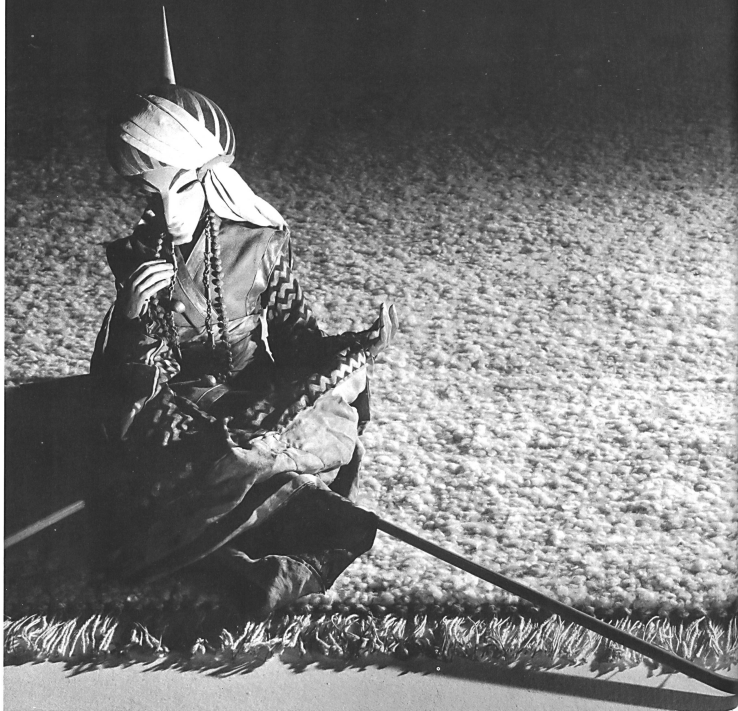
FEBAG AG, MUOTATHAL