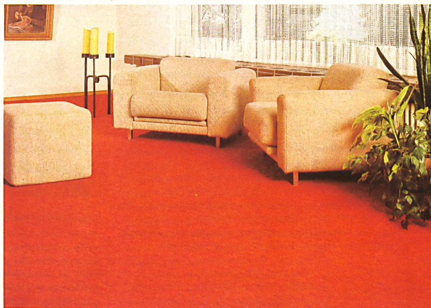
« Lagonda »