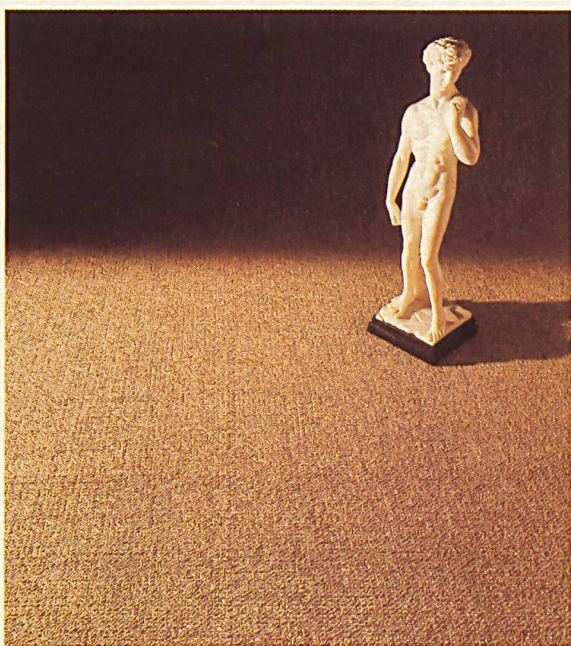
Alpina « Herkules »