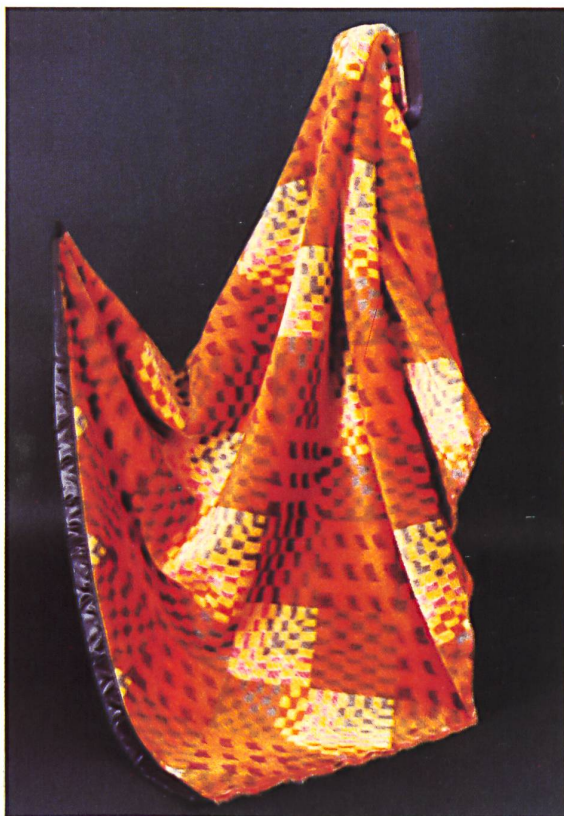
Einige Beispiele aus der Serie « Geflechte ». / Quelques échantillons de la série « Vannerie ». / A few samples from the "Basketwork" range. / Qualche esempio della serie « Reticolati ».

Die Eskimo-Schlafdecken mit ihrer aussergewöhnlich hohen Qualität — man denke nur an die Spezialitäten aus reinem Kaschmir, aus Lama, Kamelhaar oder feinsten Schurwolle — haben sich auf allen Märkten einen unübertroffenen guten Ruf geschaffen. Um noch mehr Abwechslung in das schon breitgefächerte Angebot zu bringen, hat das Unternehmen mit dem Faserhersteller Du Pont eine Neuheit entwickelt, die ebenso praktisch wie dekorativ ist: die Heimdecke. Diese neuen Studio-Decken aus reinem Orlon® weisen einen fellähnlichen, permanent weichgriffigen Flor auf, der mittels einer raffinierten Spezialausrüstung erreicht wird. Neu, ungewohnt und akzentreich sind die Jacquarddessins dieser sorgfältig mit Bandabschluss konfektionierten farbenfrohen Decken. Sie werden in verschiedenen Dessingruppen angeboten wie Folklore, Geflechte, Men's wear, Oriental, Patchwork. Selbst eine von Schweizer Künstlerhand entworfene Frauenfigur mit Kopf ist in die Serie integriert. Die Farbkombinationen entsprechen den gültigen Wohntrends und bringen äusserst wohliche Dekorationseffekte ins Interieur. Die neue Eskimo-Spezialität hilft eine durch die veränderten Wohngewohnheiten sichtbar gewordene Marktlücke schliessen und befriedigt zwei Bedürfnisse auf einmal: modisch dekorativer Überwurf am Tag — mollig warme Schlafdecke bei Nacht.