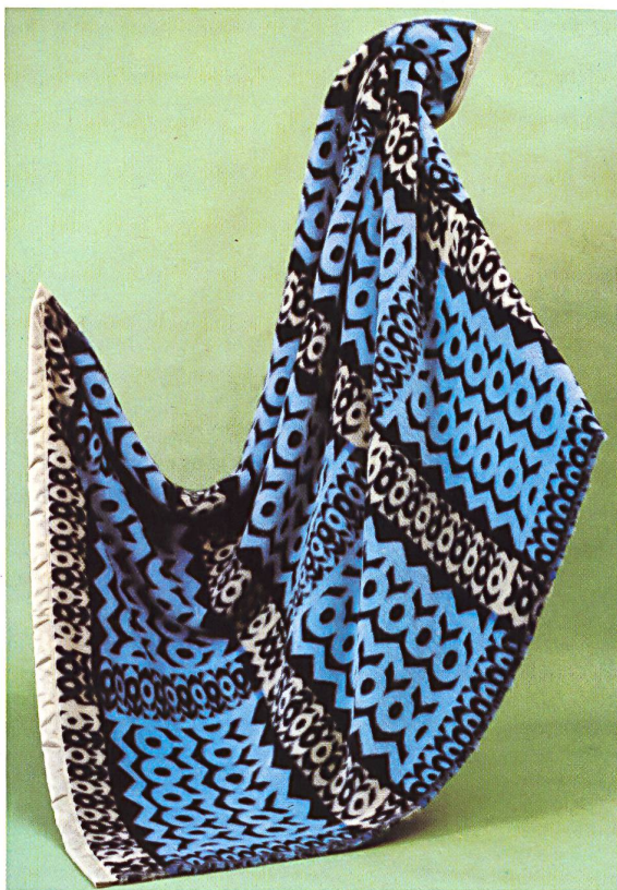
SCHWEIZERISCHE DECKEN- UND TUCHFABRIKEN AG, PFUNGEN