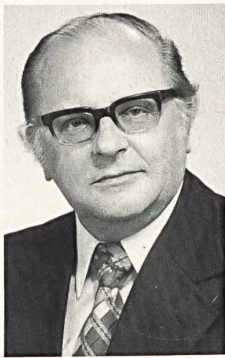
J. ARLITT WEBEREI GRÜNECK AG GRÜNECK