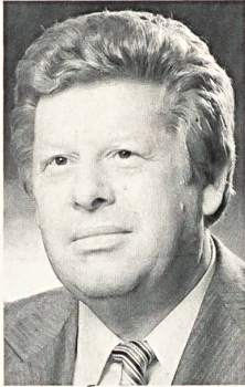
O. HOFMANN AG vorm. HOFER + CO. ZOFINGEN

Langsam stellen auch Hotels, Altersheime und Anstalten auf farbige Bettwäsche um; bei Neueinrichtungen zieht man zudem immer mehr die Annehmlichkeit des nordischen Schlafens in Betracht. Da jedoch bei dieser Entwicklung erhöhte Anforderungen an die bunte Bettwäsche durch stärkere Beanspruchung bei öfterem Waschen gestellt werden, ist die Antwort darauf garnegefärbte Qualitäten mit modischer Jacquard-Dessinierung, da diese den Sicherheitsfaktor der langlebigen Farbechtheit viel eher garantieren als Druck. Hochwertiger Bettwäsche-Damast hat also durchaus seine echte Erfolgchance.