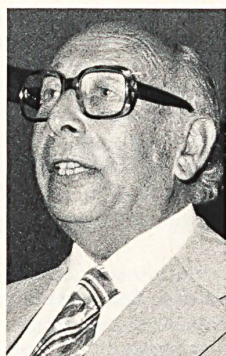
M. GUT AG WEBEREI WETZIKON ADLISWIL