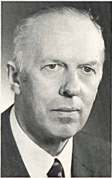
H. REISER SCHLOSSBERG TEXTIL AG ZÜRICH

Übrigens haben wir uns für das nordische Schlafen noch eine Neuheit einfallen lassen: Damit die Füße bei unruhigen Schläfern nicht plötzlich frei liegen, konfektionierten wir einen an den Deckenanzug unten anzuknüpfenden Einsteckklatz, der unter die Matratze geschoben wird und die Decke dadurch festhält.