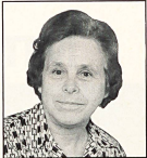
LORE WOLF Abt. Bettwäsche der Firma C.F. Braun, D-Stuttgart

Was die Dessins-Vorliebe anbelangt, werden nach meiner Beobachtung von den Kundinnen vorwiegend «Versailles», dann «Masumbai» und «Clifton» gewählt.»