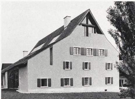
Die «Galerie zur Hofstatt», eine Begegnungsstätte von Handwerk, Kunst und Wohnen.

△ Eine wohnliche Cafeteria mit bequemen Sitzgelegenheiten — mit Schweizer Möbelbezugsstoffen überzogen — sorgt vor dem prachtvollen Glasfenster, welches der Künstler H. Stöcker seinerzeit für die Expo in Lausanne geschaffen hatte, für das leibliche Wohl der Besucher.