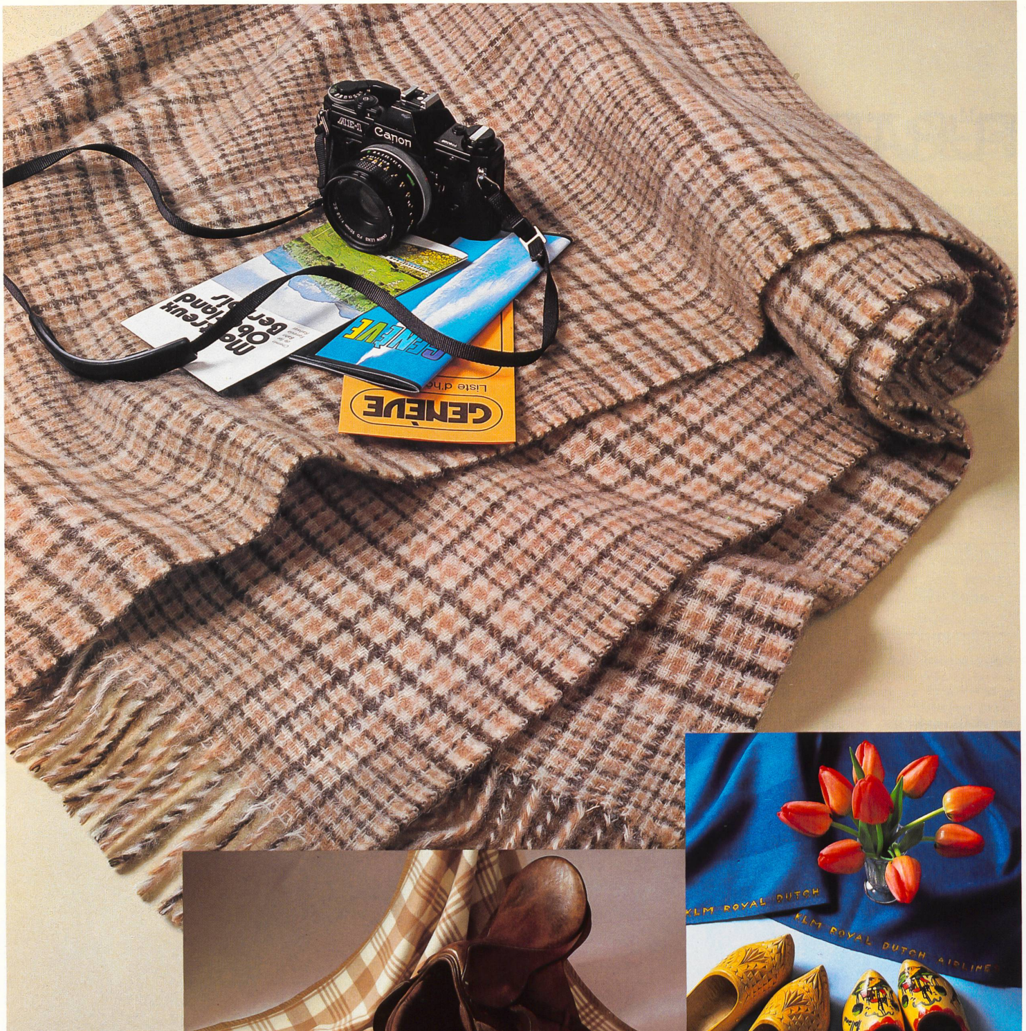
Reiseplaid in reiner Wolle • Plaid de voyage en pure laine • Pure wool travelling rug • Plaid da viaggio di pura lana.