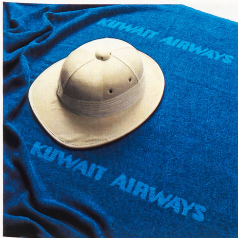
Flugzeugdecken in Modacryl • Couvertures pour l'aviation en modacryl • Airline blankets in fashion acrylic • Coperte da volo di Modacryl.

La lunga esperienza nella tessitura delle sigle e degli emblemi commerciali autorizza la Ditta a creare ogni tipo di coperta pubblicitaria, per luoghi di cura, alberghi, società di vela o di surfing, marche di autovetture, ecc. La Ditta ha pure saputo farsi una rinomanza nella sfera delle coperte da volo, leggere benché caldissime. Ciò permette di dire, senza esagerazione: «Le coperte Eskimo fanno il giro del mondo!»