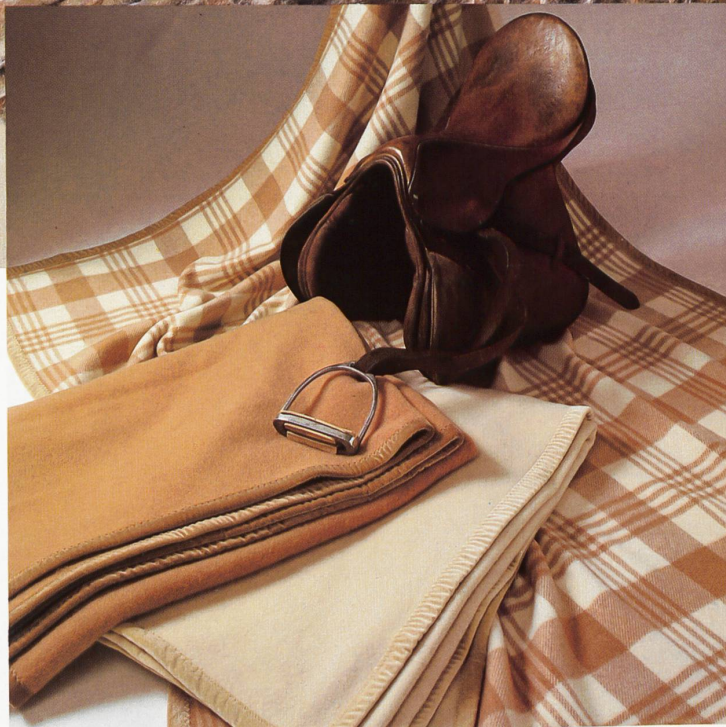
Schlaf-/Wohndecken in reiner Wolle/Kaschmir • Couvertures de lit et d'intérieur en pure laine et cachemire • Pure wool/cashmere blankets for bed and lounge • Coperte da letto e d'appartamento di pura lana e cachemire.