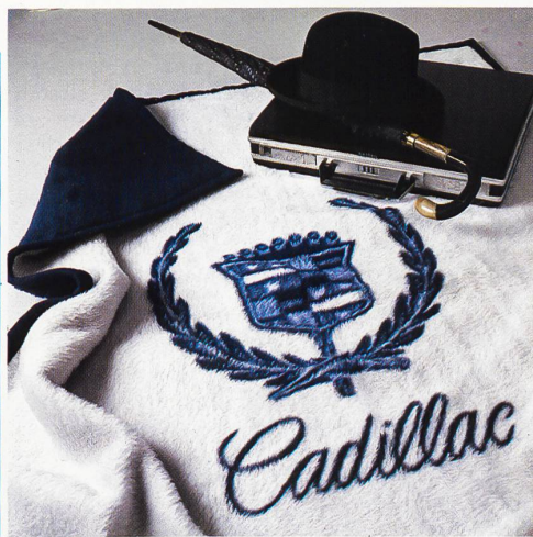
Werbedecken in Orlon® • Couvertures publicitaires en Orlon® • Advertisement in blankets in Orlon® • Coperte pubblicitarie di Orlon®.