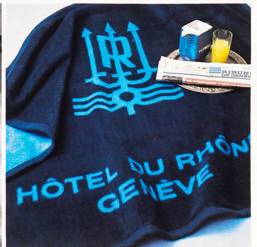
Hoteldecken in Orlon® oder Naturfasern • Couvertures pour hôtels en Orlon® ou en fibres naturelles • Hotel blankets in Orlon® or natural fibres • Coperte d'albergo di Orlon® oppure fibre naturali.