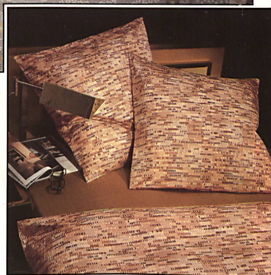
△ Bedruckter Baumwoll-Satin / Satin de coton imprimé / Printed cotton satin / Raso di cotone stampato.

F Le succès que rencontre, depuis longtemps déjà, la maison Chr. Fischbacher Co. SA à St-Gall dans le domaine du jersey pour robes, blouses et chemises se continue dans le secteur du linge de lit en jersey simple, uni et imprimé. La qualité particulière de cet article de mailles en fins retors de coton, d'entretien facile, offert en largeurs jusqu'à 200 cm, lui vaut un succès croissant, spécialement pour la confection de housses d'édredons utilisés pour dormir à la nordique, son prix plus élevé étant compensé par son con-