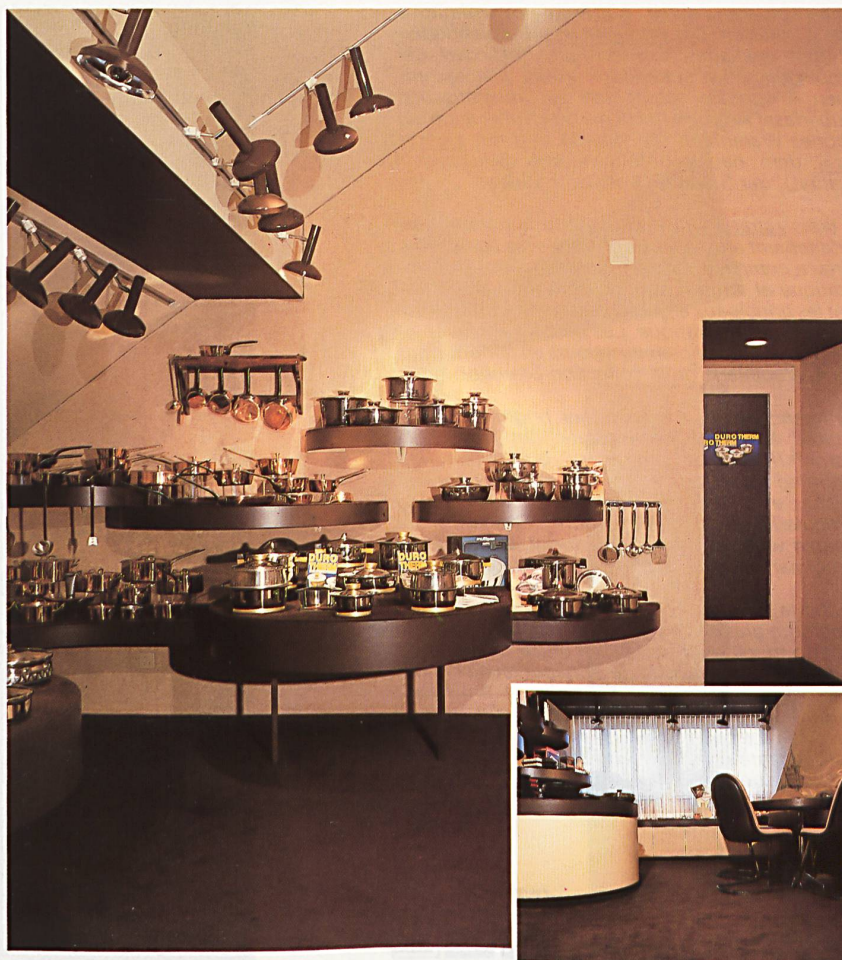
«perltwiss object 1»

Per esporre le merci in modo rappresentativo ci vuole un contesto opportunamente arredato. In questo locale il tappeto «perltwiss object 1» di «Enka Stat®», largo 420 cm e il fine velluto di pura lana, pure esso largo 420 cm, che riveste la parete, diffondono un'atmosfera elegante e gradevole.