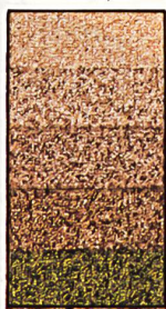
ultrawiss 5/64" Nylon