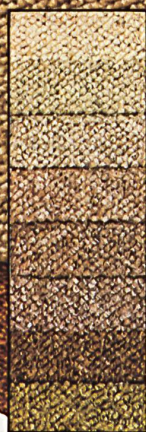
terratwiss 5/16" Enka stat