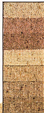
marabu RO* 5/32" Acryl/Wolle