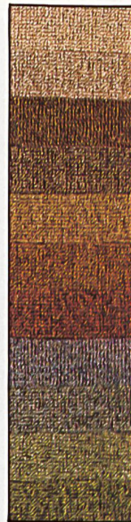
stratotwiss 1/8" Antron® III HF

F La collection Stamflor, qui se doit de satisfaire aux nombreuses exigences du bâtiment et de l'habitation, est particulièrement riche. Elle est aussi régulièrement amendée de qualités ayant un aspect nouveau ou appelées à répondre à des impératifs fonctionnels particuliers, nées d'une étroite collaboration entre la société Stamm et les architectes et le commerce spécialisé.