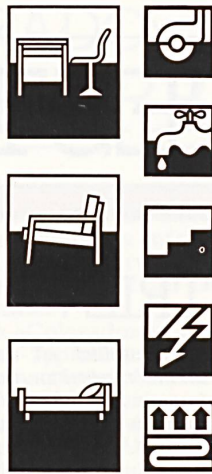
Freilverwendbare Bildsymbole kennzeichnen Eignungs- und Zusatzeignungsbereiche

Von der EMPA geprüfte Teppichqualitäten dürfen mit Bewilligung der Direktion der EMPA und unter Angabe der Attest-Nummer mit dem Vermerk «EMPA geprüft» gekennzeichnet werden. Dies kann mittels der vom VSTF kreierten Etikette erfolgen, wobei das Verwendungsrecht den Verbandsmitgliedern vorbehalten ist. Dagegen sind die ursprünglich von der Europäischen Teppichgemeinschaft (ETG) eingeführten und 1973 vom VSTF übernommenen Symbole