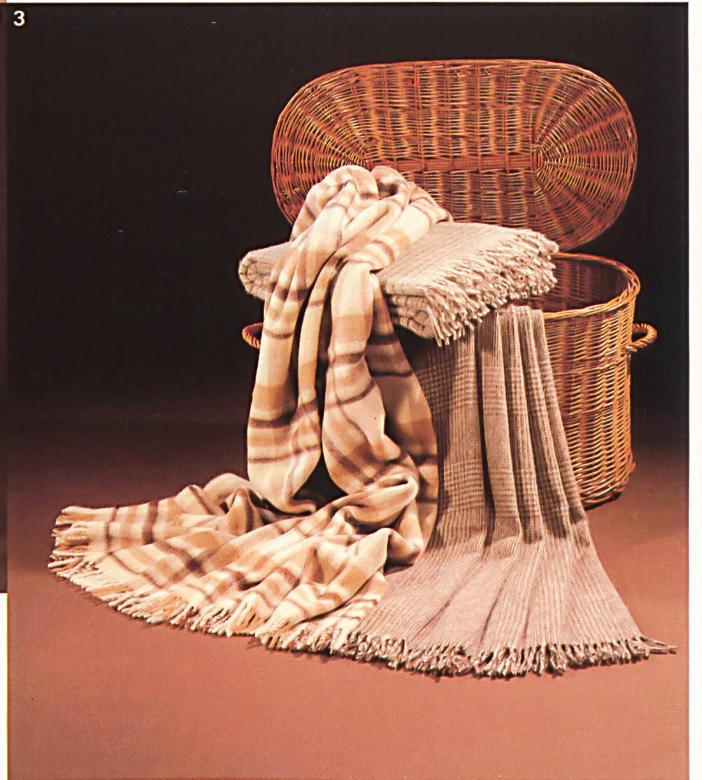
1 «Charme», 30% Kaschmir/70% Merino. 2 «Superstar», 20% Kaschmir/80% Merino. 3 «Alpalux», 85% Lama/15% Merino.