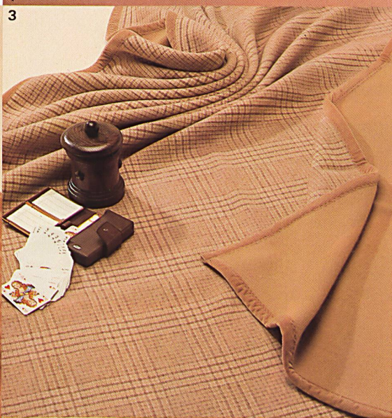
1-3 «Supra», 30% Kaschmir/70% Merino.