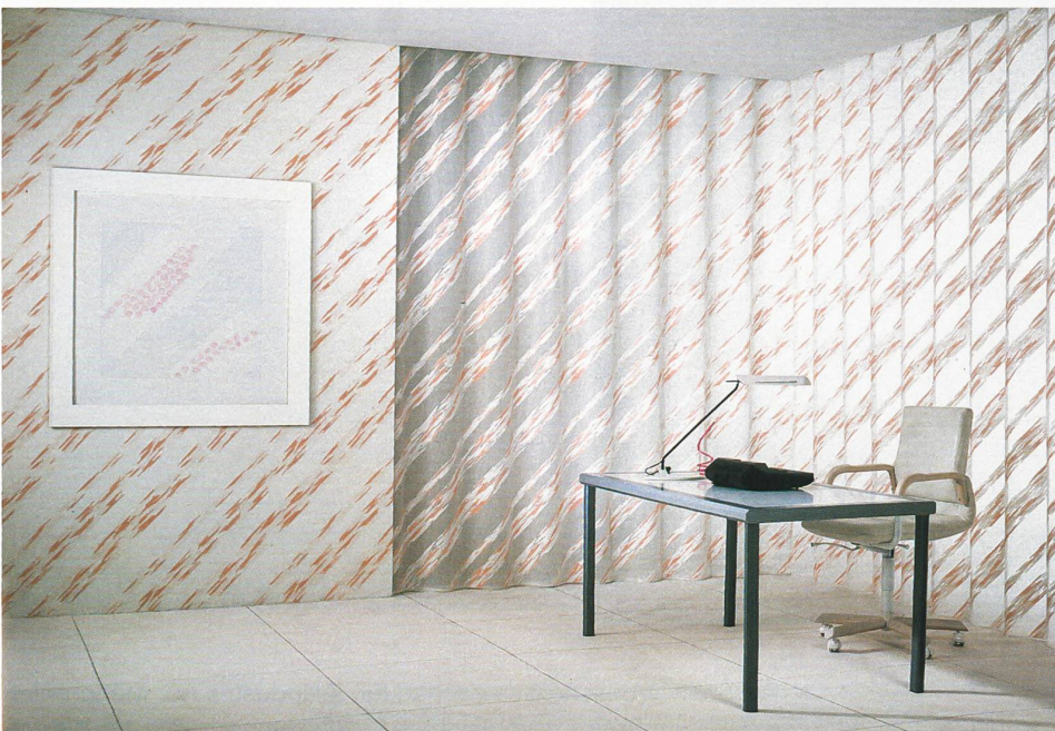
△ Aus der Gruppe Grafik: Dessin «Dreieck» Leuchtende Farben betonen modernes, geometrisches Design.