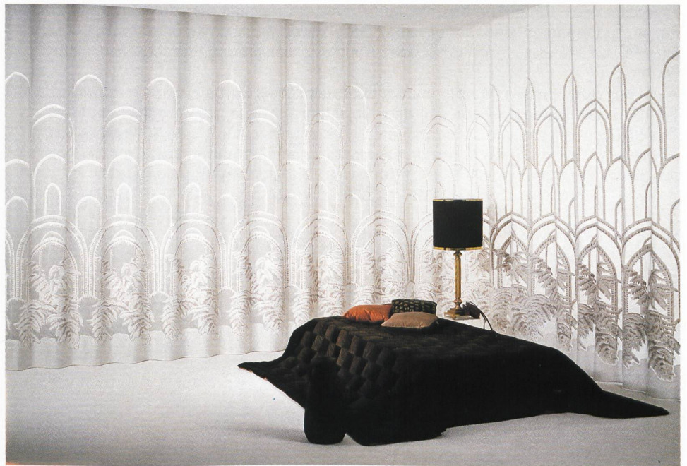
△ Aus der Gruppe Fantasie: Dessin «Feuerwerk» Natürliche Gegebenheiten in jugendlich modernem Dessin.