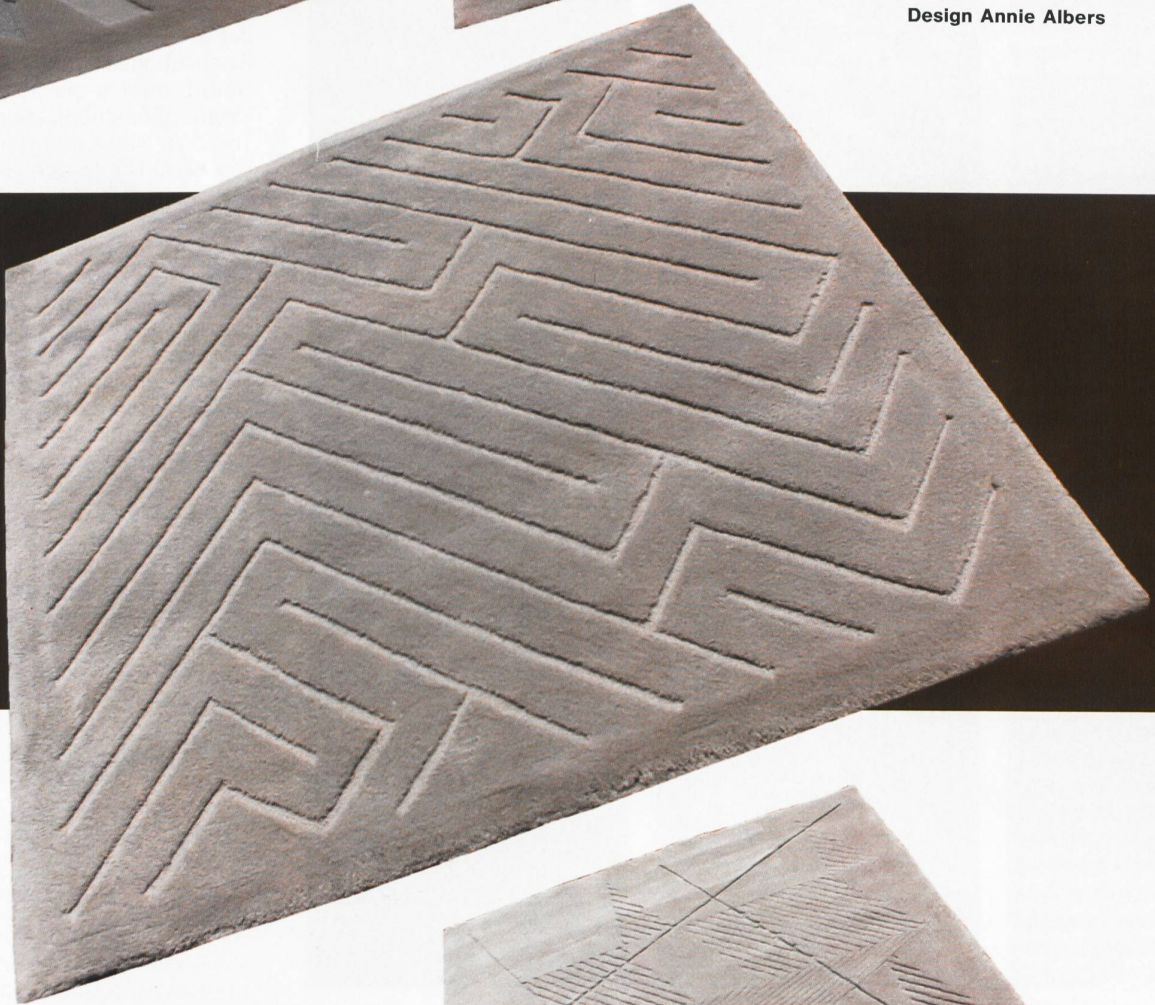
«MAZE» Design Annie Albers