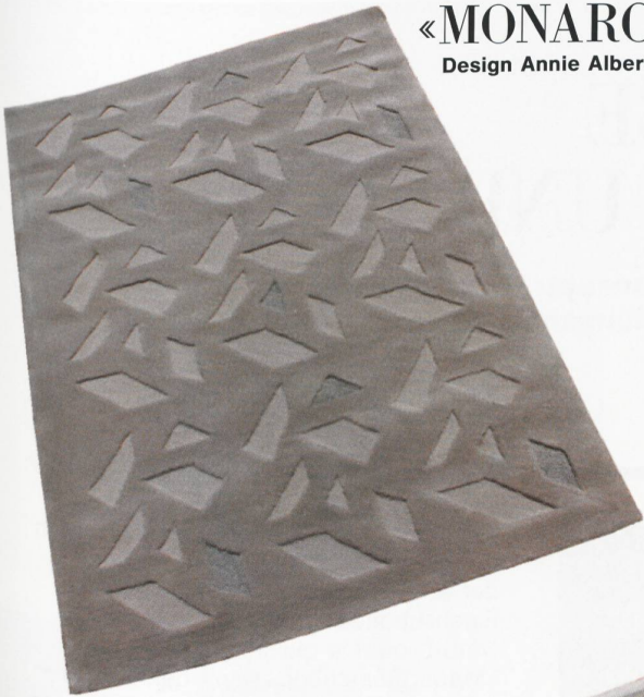
«MONARCH» Design Annie Albers