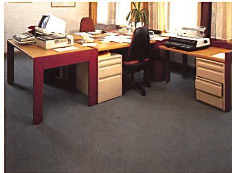
Kantonalbank Herisau Dessin 452