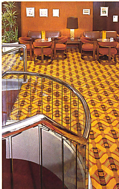
Hotel Hilton, Basel Dessin 729