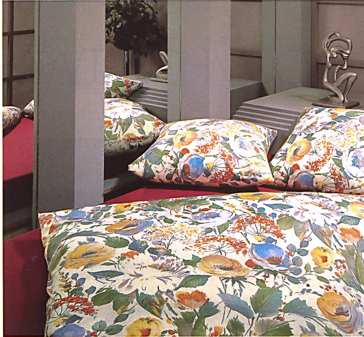
«Sinfonia» auf Jersey Royal, ein romantisches Blumenmuster, erhältlich in Jaune, Bois de Rose und Aqua.

Wie schon erwähnt, sind die Farbtonwerte leicht angehoben, die Kontraste lebhafter, das Farbspiel breiter geworden. Manchmal unterstreicht ein Weissfond die gewünschten Effekte. Abricot ist ein neues Kolorit im Bettwäsche-Sektor, das sich gut in die Gamme von Bois de Rose, Aqua, Cannelle, Sable, Argent, Palmier und Lavande einfügt.