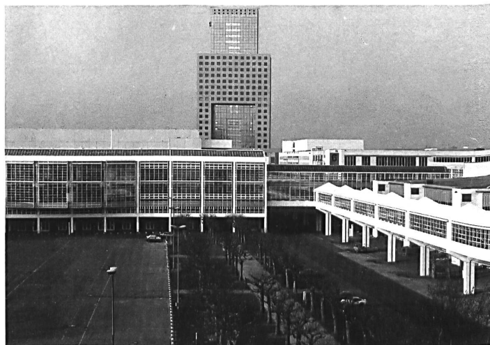
Das «Haus für Heimtextilien», die «Via Mobile» und das neue 117 m hohe Service-Center auf dem Frankfurter Messengelände.

Eine Neuheit auf dem Gebiet der Textilmesse wird die im kommenden Jahr vom 10. bis 12. Juni stattfindende internationale Fachmesse für den Markt technischer Textilien «TECHTEXTIL» darstellen. Im Gegensatz zu den beiden etablierten Textilmesen «Heimtextil» und «Interstoff» soll die «TECHTEXTIL» das Angebot gewebter und nicht gewebter Textilien, Tauwerk und Netze für technische Verwendungszwecke umfassen. Schwerpunkte dieser Special-Interst-Messe sind Textilien für industrielle Anwendungen, Fahrzeugbau, Hoch- und Tiefbau, Landwirtschaft, Personenschutz und Medizin.