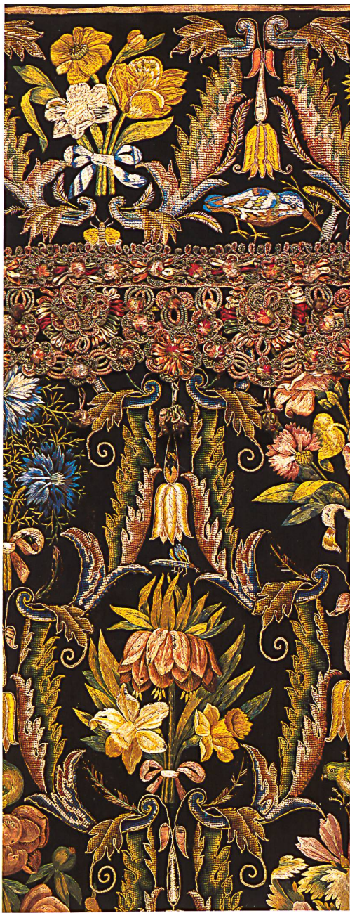
▽ Fragment eines Bettvorhangs, Frankreich oder Niederlande, Mitte 17. Jh. Nadelmalerei, gestickte Applikationen und Posamente