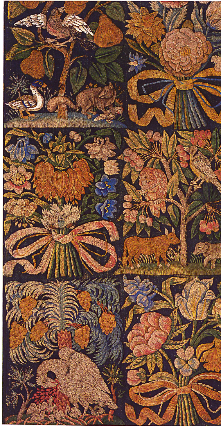
Wandteppich aus umgearbeiteten Bettvorhängen, England oder Niederlande, um 1675. Nadelmalerei, Flachstich in Wolle auf blauem Wollkörper

Das europäische Mittelalter kannte keinen reichen Blumen- seggen. Nur kleine, eher unscheinbare Blüten zierten die Gärten. Die Kenntnis der exotischen Blumenwelt beschränkte sich auf bildliche Darstellungen und Abbildungen auf Kunstwerken, die Reisende aus fernen Ländern nach Europa brachten. Chinesi- sches Porzellan mit stilisiertem Blumendekor und antike Herbar- rien waren Träger frühester Blumendarstellungen.