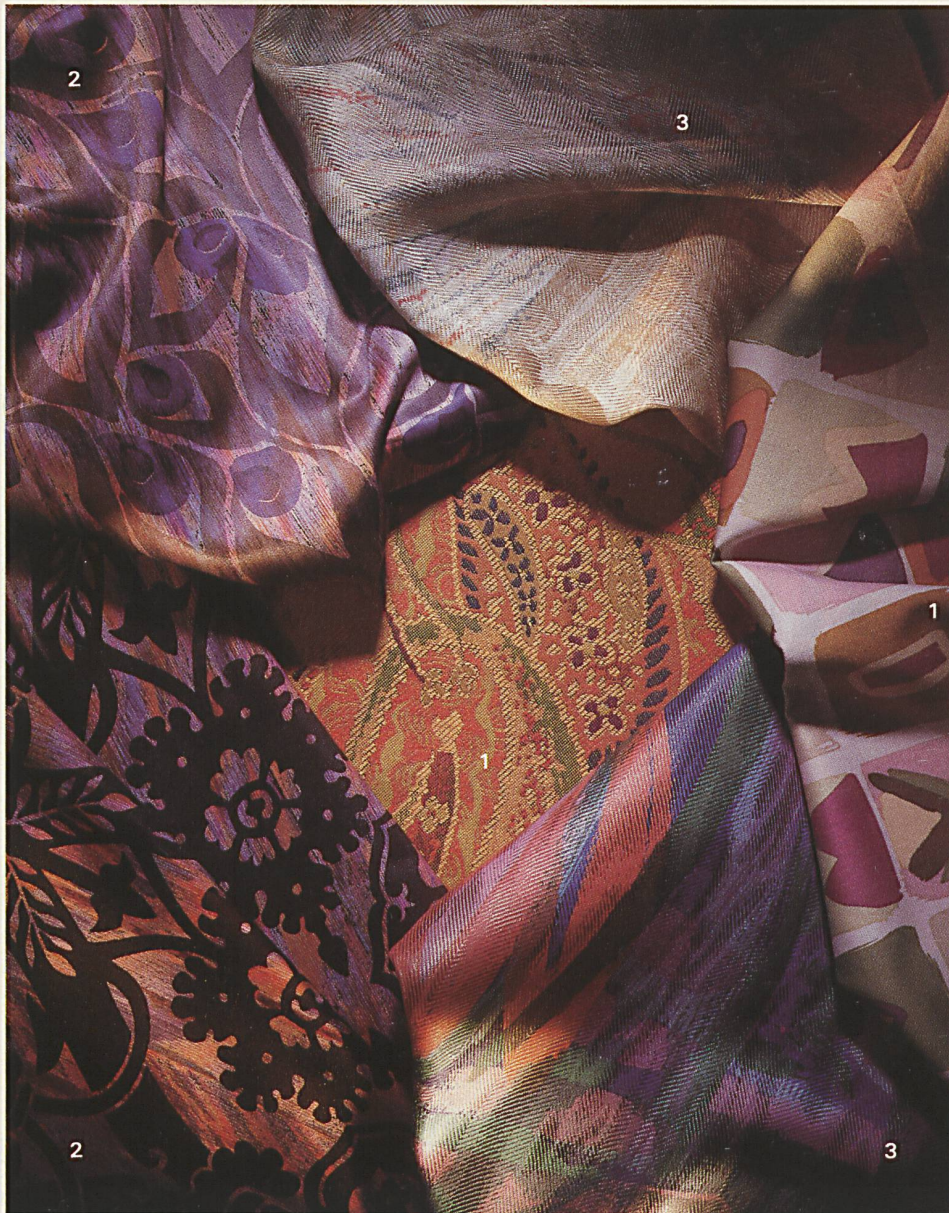
Dekostoffe 1 Christian Fischbacher Co. AG, St. Gallen 2 Heberlein Textildruck AG, Wattwil 3 Tisca Tischhauser+ Co. AG, Bühler