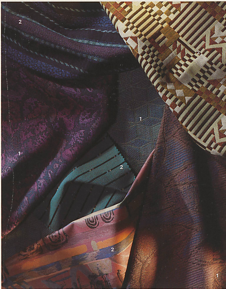
Möbelstoffe 1 Jacob Rohner AG, Heerbrugg 2 Tisca Tischhauser + Co. AG, Bühler

Luxus, falls man das Wort im engen Rahmen des Langenscheidt definiert, der von «einem Aufwand, der den normalen Rahmen der Lebenshaltung übersteigt», spricht.