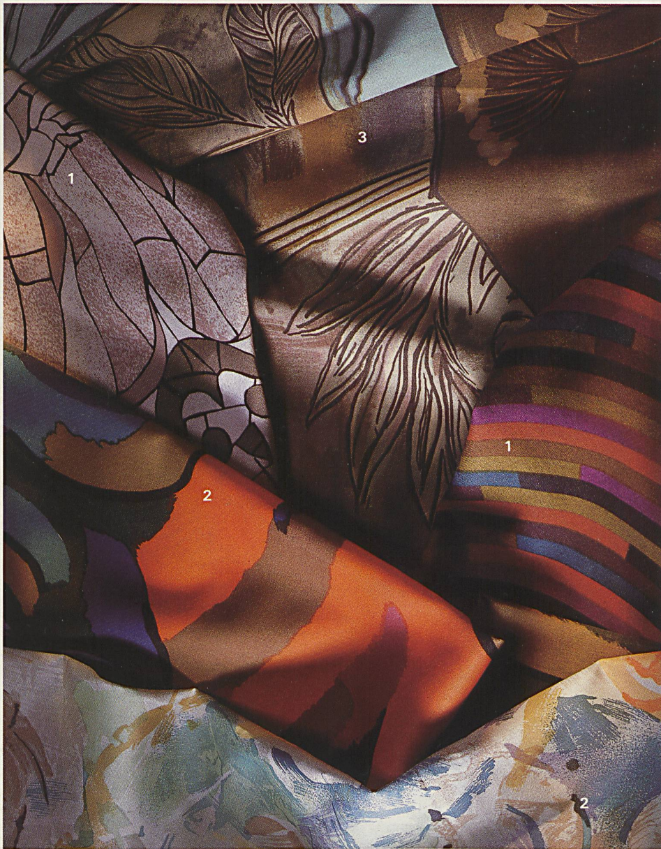
Bettwäsche 1 Boller, Winkler AG, Turbenthal 2 Christian Fischbacher Co. AG, St. Gallen 3 Schlossberg Textil AG, Zürich

Der Langenscheidt sagt es klar und deutlich und apostrophiert Mode als «Brauch und Sitte zu einem bestimmten Zeitpunkt» oder als «Tages- und Zeitgeschmack», die Moderne aber als «neue Richtung in Literatur und Kunst» oder als «die jetzige Zeit und ihr Geist». Da ist sie schon fast komplett, die Verwirrung um den Begriff der Mode, um modern, um modisch und um die Moderne.