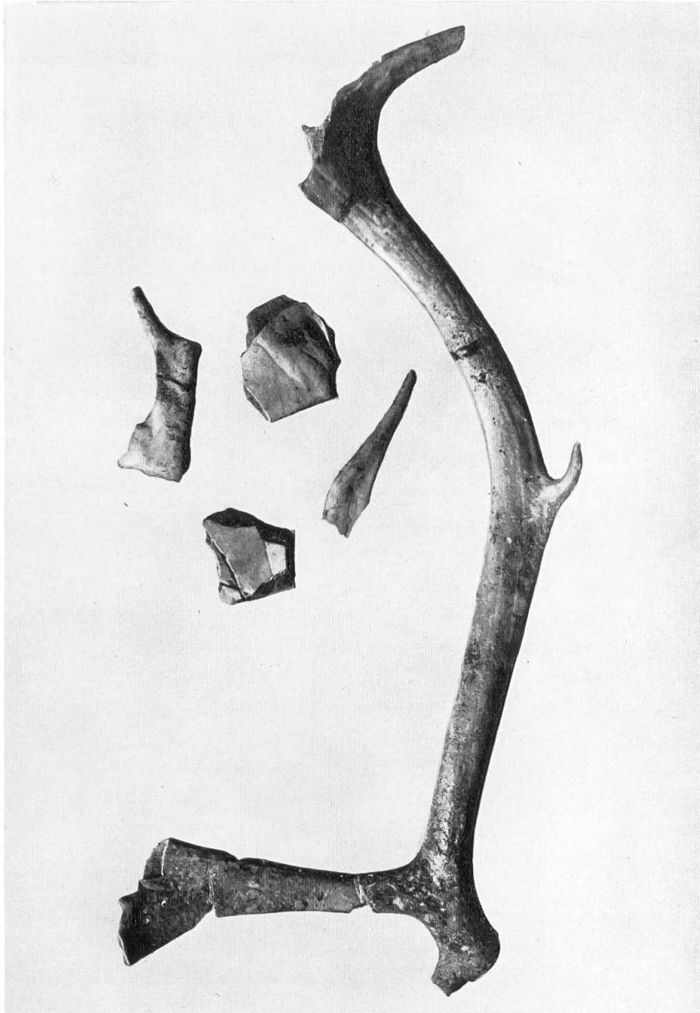
Tafel II. Renniergeweih, rechte Stange aus einer Sandgrube von Nesselbach, gefunden Oktober 1929.