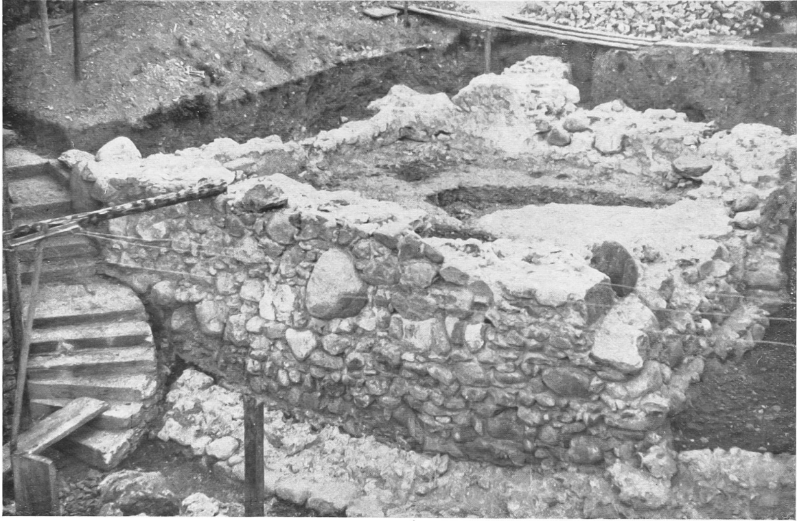
Die Burgruine Boswil.