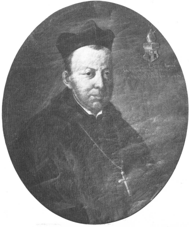
Abt Plazidus Zurlauben, der barocke Bauherr, seit 1701 Fürstabt. — Text S. 10.

liess, der infolge der Ungunst der Zeit bloss zur Hälfte (Ost- und Südtrakt) ausgeführt werden konnte. An die Stelle der rhythmischen Auflockerung der Bauteile trat der geschlossene Baukörper, an die Stelle des Malerischen das Monumentale. «Der unter Fürstabt Gerold II. Meyer im Jahre 1790 von Valentin Lehmann begonnene Klosterneubau ist der letzte und dem Projekt nach zugleich grösste barocke Klosterbau der Schweiz.» 7 Wir kennen den Torso aus den Zeichnungen, zum Teil Lithographien, des P. Leodegar Kretz, Heinrich Triners und seines Schülers Br. Burkard Küng. 1889 ging der Osttrakt in Flammen auf und wurde nur unzulänglich wieder aufgebaut.