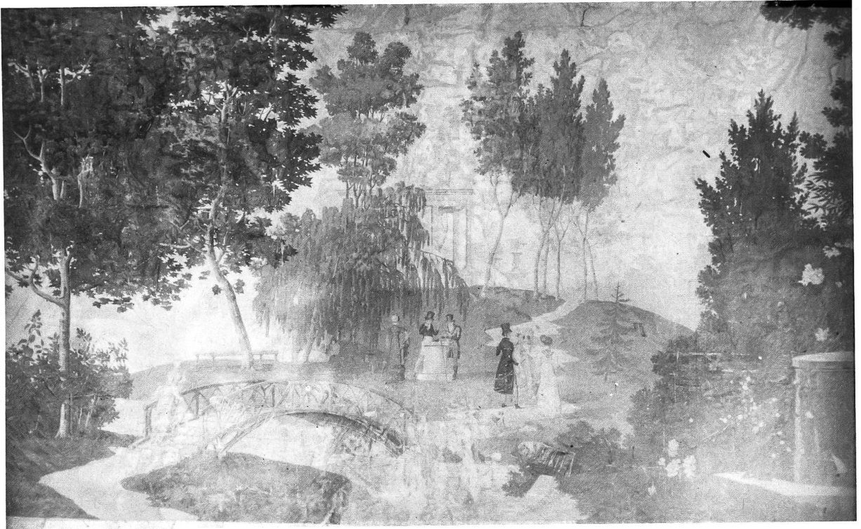
93 Abb. 3