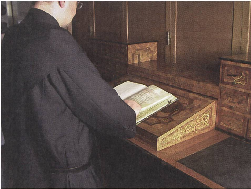
Beim Lesen im Kollegium Sarnen