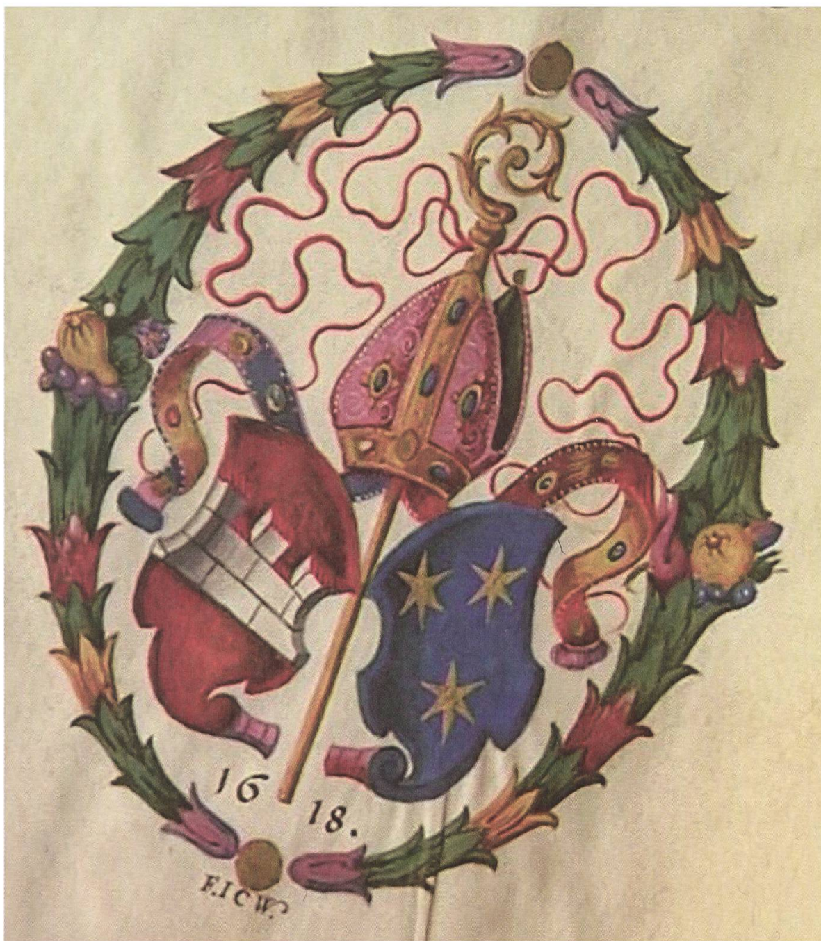
Handgemaltes Ex Libris aus dem Murenser Professrituale von 1618 mit den Wappen der Abtei Muri und der Familie Singisen.