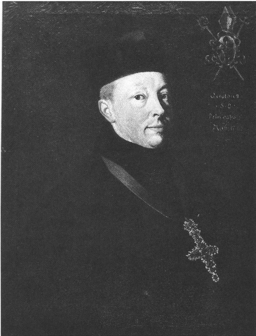
Abbildung 3 Fürstabt Gerold II. Meyer von Muri. Ölgemälde von Josef Reinhard, 1781

[Er wurde] auf einer Reise, in Verrichtung seines Dienstes, von piemontesischen Banditen aus Hass gegen ihren Fürsten meuchelmörderisch angefallen, mit einem Strick von Ferne, gleich einem wilden Thiere, jählings umschlungen, von seinem Pferde gerissen, auf dem Boden gewaltthätig geschleppt, mit Messerstichen getödtet, in eine Grube ungelöschten Kalks verlochert, bald hernach halb verbrannt wieder ausgegraben, zu Stücken und Riemen zerschnitten, und abermals unter die Erde verscharrt worden. Der Himmel liess die Unthat nicht ungerochen, er lieferte die Bösewichter dem Arme der Gerechtigkeit aus, und sie empfingen die blutige Vergeltung für ihre unmenschliche Wuth. 29