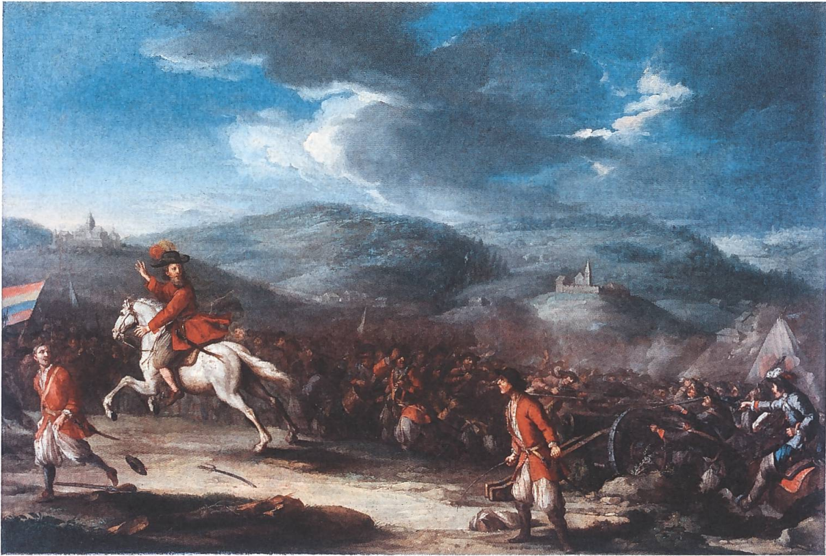
Abb. 6: Flucht der Innerschweizer nach der Schlacht bei Villmergen. Zeitgenössisches Gemälde von Johann Franz Strickler (Schweizerisches Nationalmuseum, LM-16809).

sierung der Schweiz im 18./19. Jahrhundert und gipfelte über die nächsten Generationen in einem Bildungsdefizit in den katholischen Stammlanden. Dies vermutlich nicht zuletzt wegen des starken Einflusses von Kapuzinern und Dorfgeistlichen auf dem Lande. 68