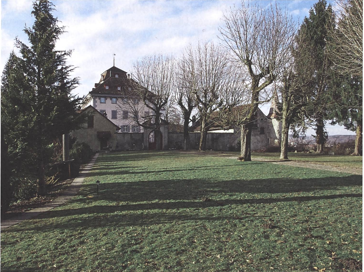
Abb. 7: Schloss Hilfikon.

abstimmung) scheint neue Gräben aufzureissen. Christian Bäder hat mit Recht darauf hingewiesen, dass «in Krisenzeiten [...] zwischen Andersgläubigen bis heute die Kirchenzugehörigkeit oft missbraucht» werde, denn so lasse sich der Gegner «leichter als böser Feind, als Abtrünniger vom gottgewollten Weg definieren.» 91