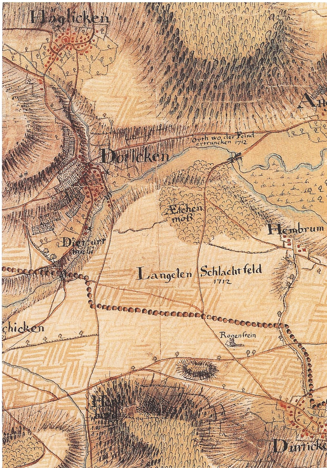
Abb. 4: Ausschnitt aus der Karte Johann Adam Riedigers aus dem Jahre 1714, mit dem «Langelen Schlachtfeld» des Zweiten Villmergerkrieges. Rechts des Ortsnamens «Doticken» weist er auf den «Orth wo der Feind ertruncken».