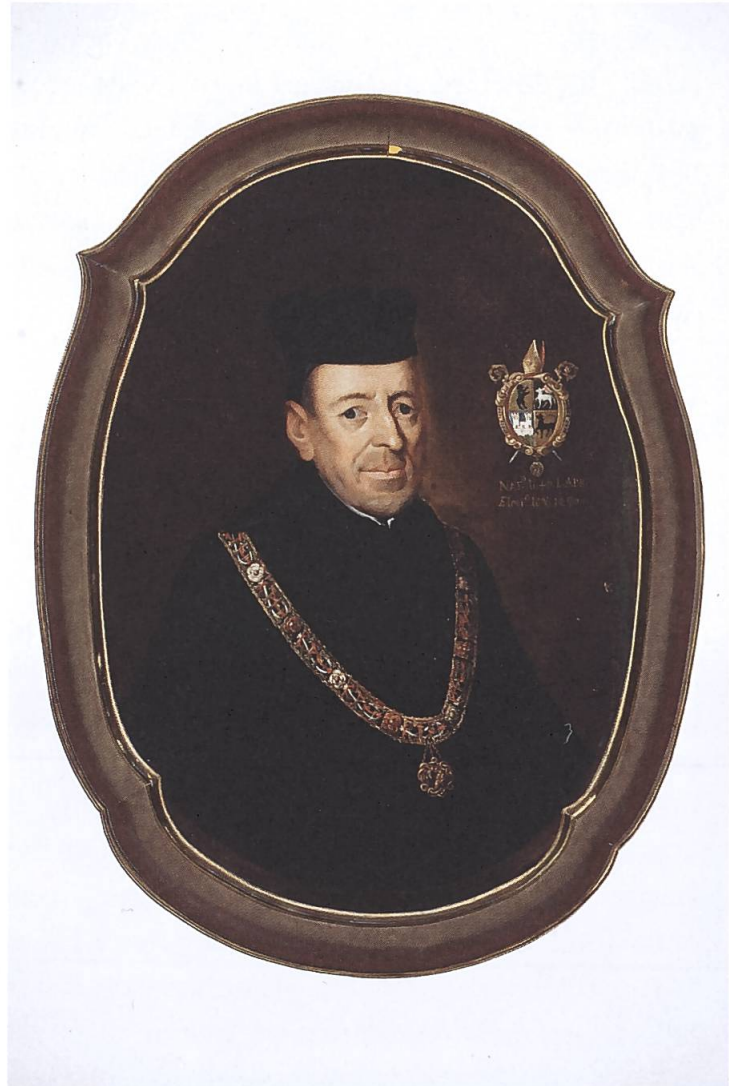
Abb. 3: Abt Leodegar Bürgisser (1640–1717). Als Fürstabt des Klosters St. Gallen provozierte er die Unruhen im Toggenburg, insbesondere wegen der geplanten Strasse über den Ricken. Die Unruhen wurden zum Anlass des Zweiten Villmergerkrieges oder Toggenburger Krieges.

1912 diese Ansicht übernommen, wenn er schreibt: « Schon im 17. Jahrhundert wurden die Toggenburger vom Abt von St. Gallen wiederholt in ihren Freiheiten bedroht. » 34 Zürich oder Bern hätten nie geduldet, dass sich ihre Untertanen gegen sie auflehnten.