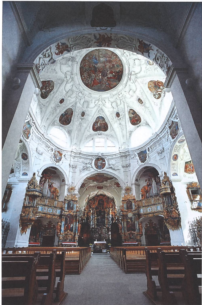
Abb. 2: Klosterkirche Muri. Barocke Sakralbauten repräsentierten das katholische Selbstbewusst- sein der Gegenreformation.

Kunstepoche », 16 sondern ihm entsprach auch « die gehobene Feierlichkeit » in katholischen Landen. 17