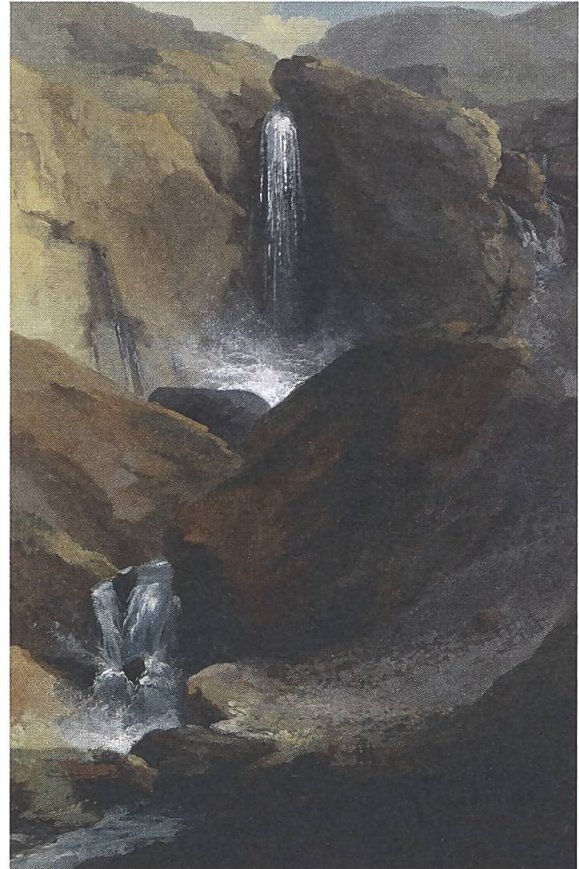
Abb. 9: Caspar Wolf, Geltenschuss im Lauenental, 1777. Öl auf Leinwand, WV 300. Kunstmuseum Basel, Depositum des Freiwilligen Museumsvereins.