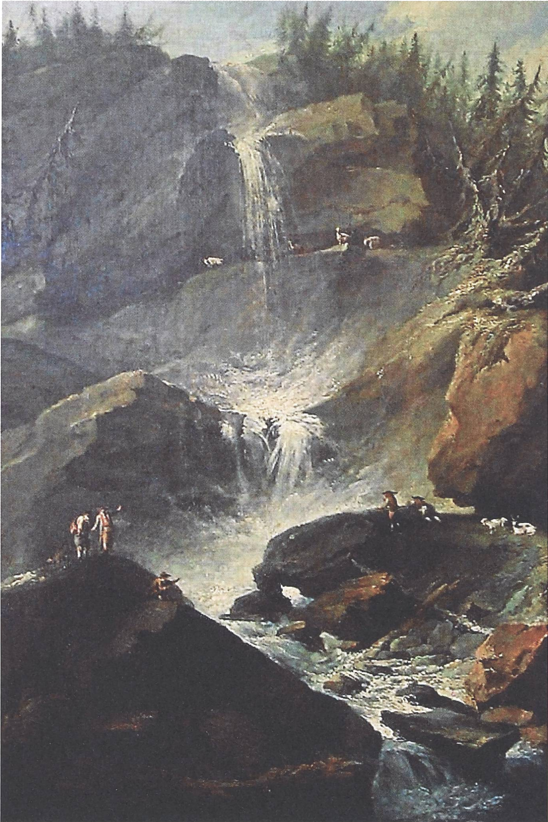
Abb. 18: Caspar Wolf. Oberer Staubbachfall im Lauterbrunnental. Öl auf Leinwand. Replik nach WV 182. Museum Caspar Wolf, Muri.