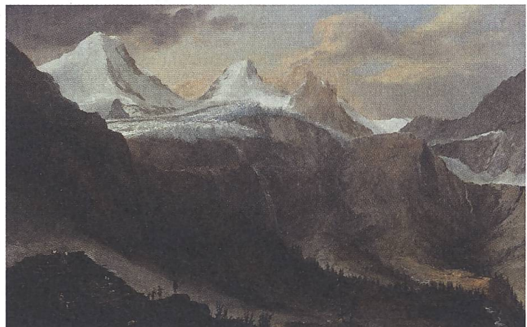
Abb. 15: Caspar Wolf, Blick von Breit- lauinen ins hintere Lauterbrun- nental, 1774. Öl auf Leinwand, WV 165. Kunsthau Aarau.