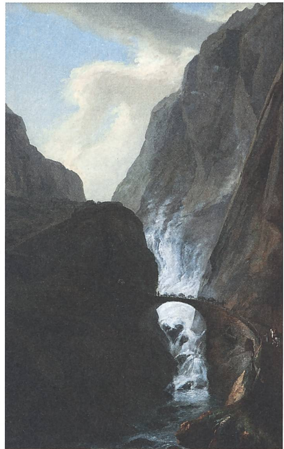
Abb. 11: Caspar Wolfs Teufelsbrücke in der Schöllenen. Öl auf Leinwand, WV 312. Kunsthhaus Aarau.