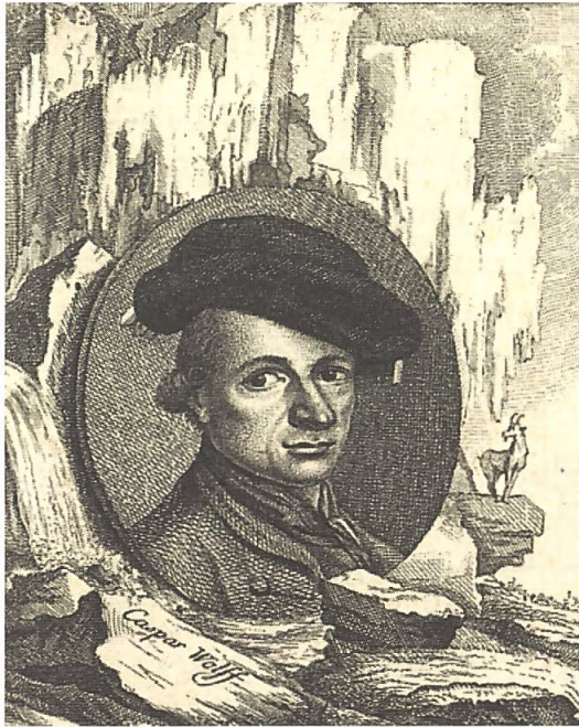
Abb. 1: Portrait Caspar Wolf. Aus: Johann Caspar Füssli «Geschichte der besten Künstler in der Schweiz», 1779, S. 110.

Karl Gottlob Küttner, schrieb über den Künstler: «Er ist äussert treu und genau in seinen Umrissen.» 3 Seitdem scheint niemand mehr systematisch versucht zu haben, die topografische Genauigkeit der Werke zu überprüfen. Ich hingegen habe versucht, die Abweichungen der gemalten von der realen Landschaft zu ermitteln und nachzuvollziehen. Denn ich bin davon überzeugt, dass die Kenntnis und die Erforschung des Terrains von entscheidender Wichtigkeit für das Verständnis der Landschaftsmalerei sind.