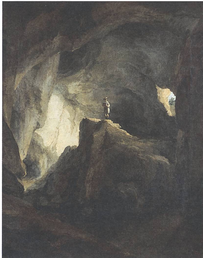
Abb. 5: Caspar Wolf, Das Innere der Bärenhöhle bei Welschenrohr, 1778. Öl auf Leinwand, WV 352. Kunstmuseum Solothurn.