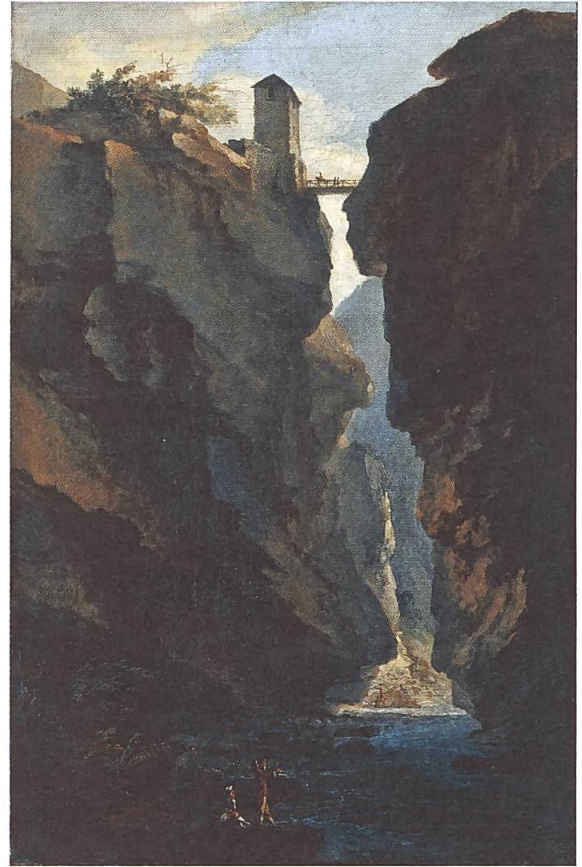
Abb. 13: Caspar Wolf, Ausgang der Dalaschlucht nach Süden, 1774/1777. Öl auf Leinwand, WV 332. Musées cantonaux du Valais.

Es handelt sich um ein vergleichsweise exaktes Gemälde, da die an der Landschaft vorgenommenen Veränderungen gering sind. Es ist bemerkenswert, dass die Landschaften Wolfs, abgesehen von den Höhlendarstellungen (so zumindest die Bärenhöhle), trotz der im Bild vorgenommenen Veränderungen immer noch mühelos wiedererkennbar sind.