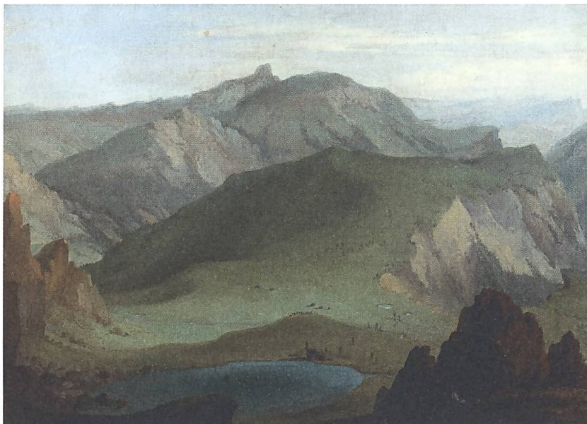
Abb. 7: Caspar Wolf, Blick von der Muntigalm über den Seebergsee, 1778. Öl auf Leinwand, WV 389. French & Company, New York.

Blick darbietet, damit er diese rasch und umfassend erkennt. Es ist im Übrigen bemerkenswert, dass Wyttenbach in seiner Beschreibung des Gemäldes die Muntigalm als einen Berg preist, von dem aus man ein besonders weites Landschaftspanorama hat, wodurch topografische Kenntnisse gewonnen werden können.