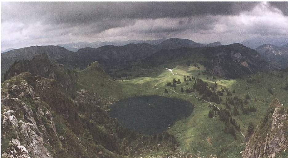
Abb. 6: Blick von der Muntigalm über den See- bergsee, 2014.

Der Seebersee ist der erste Ort, den ich in Bezug auf ein Gemälde besuchte, das nicht eine Höhle, sondern eine Landschaft zum Thema hat. In der Beschreibung Wyttenbachs erfahren wir 9 , dass das Gemälde auf der Muntigalmspitze gemalt wurde, einem kleinen, 2077 Meter hohen Gipfel, auf den Höhen von Zweisimmen im Kanton Bern. Auf den ersten Blick sollte es ganz einfach sein, den genauen Aussichtspunkt zu finden. Dies war jedoch nicht der Fall: die Muntigalm weist eine Abflachung und sogar einen Vorgipfel auf. In Bezug auf den Vordergrund war es nicht leicht, einen guten Standpunkt zu finden. Vor Ort war mir noch nicht bewusst, da dieser Aspekt zum ersten Mal auftauchte, dass Wolf eine neue Art der Änderung vorgenommen hat: der Künstler kann Elemente der Landschaft verschieben, damit sie in seine Komposition hineinpassen, und andere nicht malen, die sich eigentlich an dieser Stelle befinden.