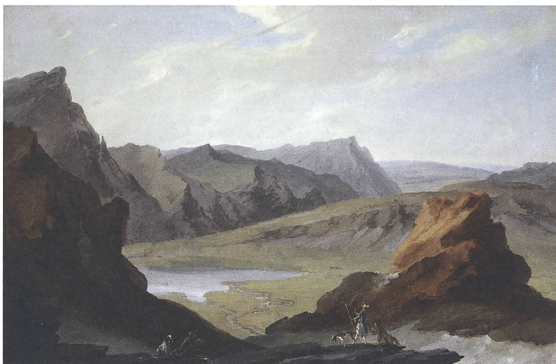
Abb. 16 und 17: Melchsee, 2014. Foto: Gilles Monney und Caspar Wolf, Blick vom Talistock auf den Melchsee. Öl auf Leinwand, WV 218. Kunstmuseum Basel, Depositum des Vereins der Freunde des Kunstmuseums Basel und des Museums für Gegenwartskunst. Foto: Martin P. Bühler.