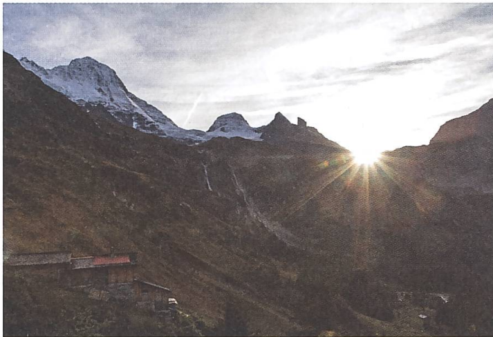
Abb. 14: Breitlauinen, 2014.

Rein historisch gesehen ist es interessant, dass gewisse Dinge sich seit dem Ende des 18. Jahrhunderts fast gar nicht oder nur wenig verändert haben. So befinden sich dort, wo auf den Gemälden Wolfs Gebäude zu sehen sind, heutzutage häufig immer noch Bauten. Die kleine Hütte in der unteren linken Ecke des Werks «Blick von Breitlauinen ins hintere Lauterbrunnental» existiert heute noch, auch wenn es sich natürlich nicht mehr um dieselbe handelt. Der Vergleich der gemalten mit der heutigen Landschaft führt jedoch auch die Veränderungen, welche die letzten 240 Jahre mit sich gebracht haben, vor Augen, insbesondere den Ausbau der Verkehrswege (wie bei der Teufelsbrücke oder der Dalaschlucht) aber natürlich auch den Rückgang der Gletscher. Trotz aller Veränderungen, die Wolf in seinen Gemälden bewusst an der Landschaft vorgenommen hat und, die in diesem Beitrag behandelt werden, ist der Künstler ein wertvoller Zeuge, der den Zustand der Landschaft am Ende des 18. Jahrhunderts dokumentiert. Seine Werke können sogar wissenschaftlich genutzt werden, insbesondere zur Untersuchung der Gletscher.