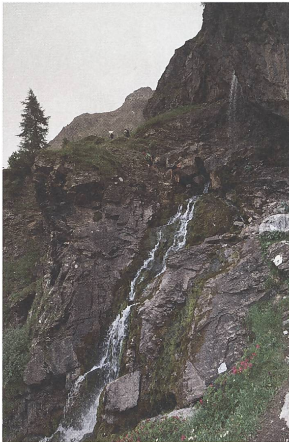
Abb. 8: Geltenschuss im Lauenental, 2014.

ich mich bewegte, um meine Position zu korrigieren, reichten schon fünf Schritte in die vermeintlich richtige Richtung aus, und ich schien erneut zu seitlich oder zu nah zu stehen. Wie schon bei der Bärenhöhle, aber dieses Mal vor Ort, behalf ich mir mit einem bestimmten Bilddetail. In diesem Fall war dieses Detail die felsige Formation vor dem Wasserfall, den wir ganz links auf dem Bild sehen. Trotz des seitlichen Blickwinkels kann man immer noch den ganzen Wasserfall auf dem Bild ausmachen. Also habe ich mich so positioniert, dass ich seitlich genug stand, um noch eine Gesamtansicht zu haben, ohne dabei den Wasserfall zu verdecken. Ich werde später noch einmal auf die Frustration zurückkommen, die man angesichts einer von Wolf gemalten Landschaft verspüren kann. In diesem Fall allerdings war es besonders frustrierend, nicht einige Meter über dem Boden in der Luft schweben zu können, was ermöglicht hätte, einen ähnlichen Blickwinkel wie Wolf zu erhalten.