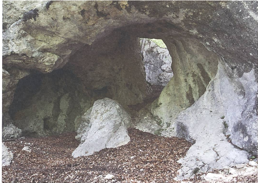
Abb. 4: Das Innere der Bärenhöhle bei Welschenrohr, 2014.

Betrachter sozusagen mit einschliesst. In diesem Bild, das übrigens nicht Teil des Wagner'schen Auftrags war, zeigt Wolf nicht in erster Linie einen Ort, sondern vermittelt ein Gefühl, nämlich wie es ist, wenn man im Berg steht, umschlossen von Felsmassen.