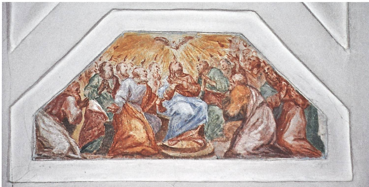
Muri, Klosterkirche. Oktagon, südwestliche Nische, Bogengurte. Pfingsten.

Die Darstellung von Pfingsten im Murianer Kleinbild zeigt grosse Ähnlichkeit mit Fresken in Pfäfers (1693/94) oder in Säkingen (1699/1701).