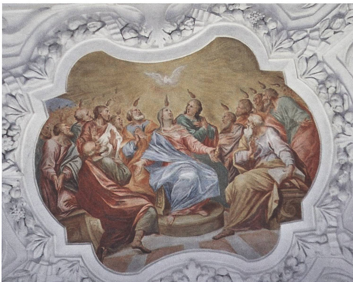
Pfäfers, Klosterkirche. Fresko Pfingsten.