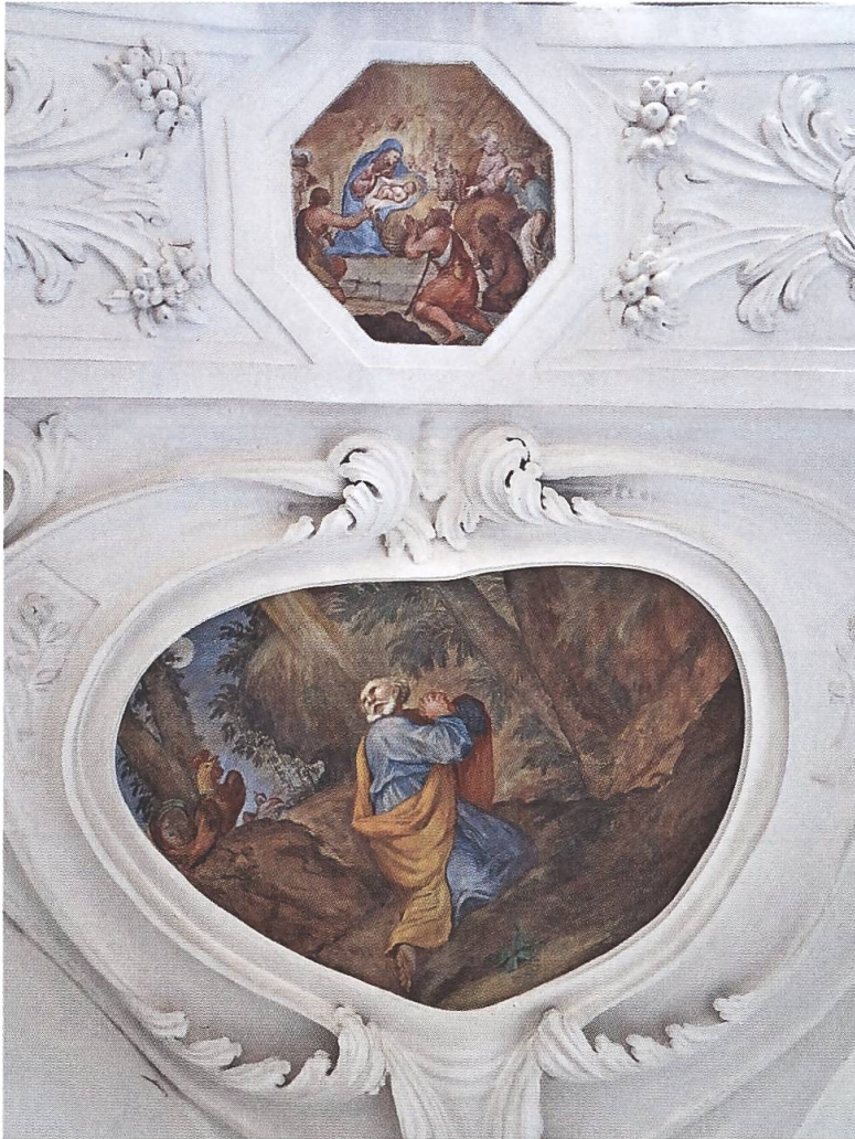
Oktogon. Nordwestliche Nische. Deckenfresko mit der Reue des Petrus. In der Bogengurte das Kleinbild von Weihnachten.

Im Oktogon der Klosterkirche befinden sich vier Musikemporen. Jede sitzt auf einer kleinen, gewölbten Nische. Die Ausstattung jeder Nische hat ein eigenes Thema, welches in einem Deckenfresko angezeigt wird.