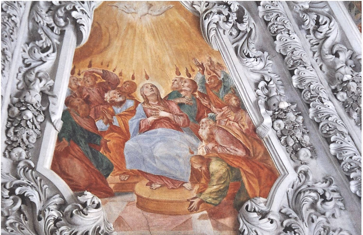
Säckingen, Münster, Apostelkapelle. Wandfresko Pfingsten.

Auch zum Thema von Busse und Reue oder der Tempelreinigung lassen sich an anderen Orten Ähnlichkeiten zu Murianer Bildern finden. Offensichtlich führte unser Meister, wie viele Berufskollegen, auf den Wanderungen eine Anzahl von Skizzen mit sich, welche er nach Bedarf immer wieder als Vorlage für seine Arbeit oder als Muster für Interessenten und Auftraggeber verwenden konnte. Leider sind uns nach heutigem Wissensstand keine solchen Arbeitspapiere von Giorgioli bekannt.