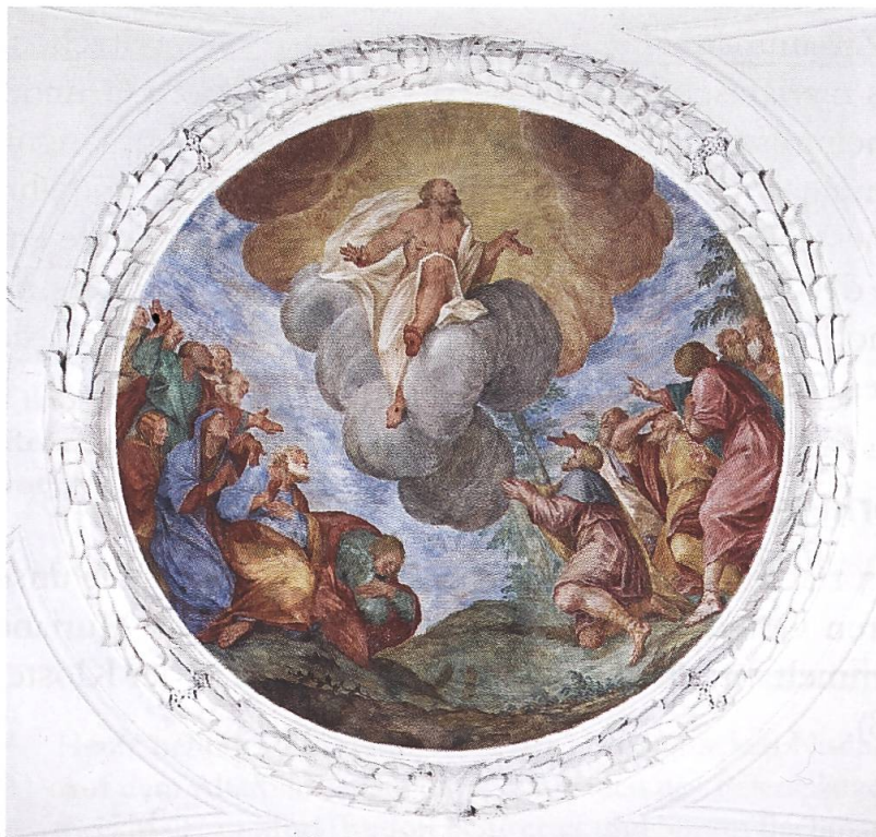
Rheinau, Klosterkirche. Deckenfresko mit der Himmelfahrt Christi. Hier fehlen die letzten irdischen Fussabdrücke.

Seine letzten irdischen Fuss- abdrücke (Bild oben) wurden seit dem späten Mittelalter von Künstlern immer wieder dargestellt (z.B. Giotto in Padua oder von einem unbe- kannten Meister in Nossa Donna, Savognin).