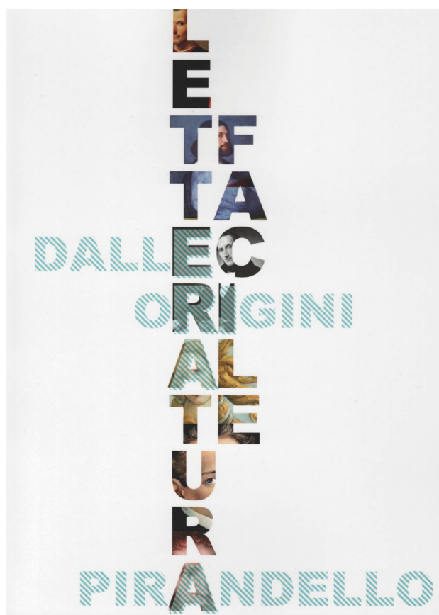
Fig. 4: Il manuale Letteratura facile (Sorba 2014)

Altri tre anni dopo, esce per mano di un insegnante di liceo il volume Letteratura facile (Sorba 2014; fig. 4), un'antologia per apprendenti che raccoglie 24 unità didattiche. Il volume rispecchia il bisogno di disporre di un manuale in cui «le nozioni fossero ridotte all'essenziale e il peso maggiore poggiasse sulla pratica: la Letteratura come qualcosa di vivo, presente, da poter capire subito, apprezzare e, nei limiti del possibile, persino imitare e riprodurre» (nota dell'autore). Il volume segue l'approccio tradizionale storico biografico combinato a un approccio stilistico-linguistico e privilegia una didattizzazione volta a focalizzare l'attenzione dell'apprendente sul contesto culturale e storico in cui l'opera è nata. Laddove necessario,