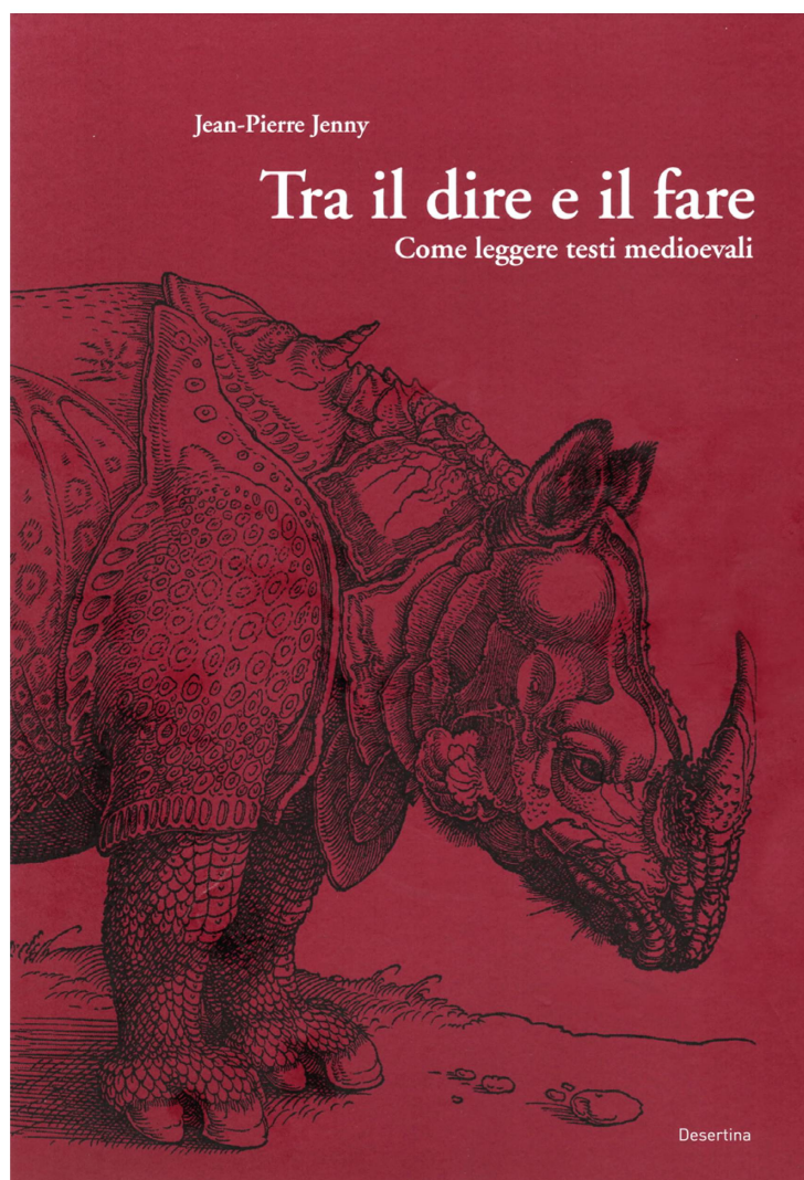
Fig. 2: Il manuale Tra il dire e il fare (Jenny 2008)

Questo è l'approccio di Tra il dire e il fare (Jenny 2008; fig. 2), una raccolta di testi e dettagliati scenari didattici per leggere testi medievali in classi di liceo a partire dal livello Bi. Jenny presenta diverse strategie sia per rendere accessibili testi che presentano grosse difficoltà linguistiche, sia per avvicinare l'apprendente alle tematiche e ai contesti storici dei testi scelti. Francesco d'Assisi viene così presentato come un ragazzo ribelle che potrebbe essere dei giorni nostri, e solo in un secondo momento, una volta creata quella attenzio-