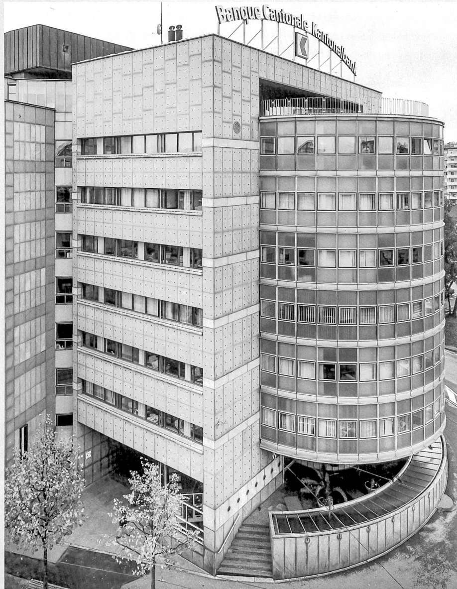
Tête du bâtiment et détail des fenêtres