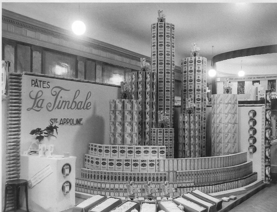
Vues du stand de la Foire aux Provisions de Fribourg, entre 1937 et 1947