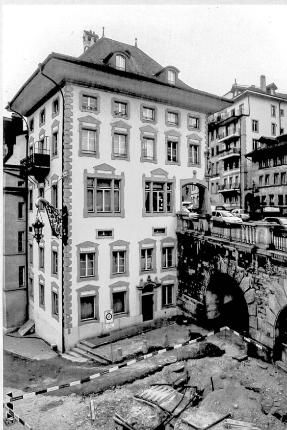
Au-dessous du niveau de la route des Alpes, la maison de Schaller-Delèsève construite en 1703