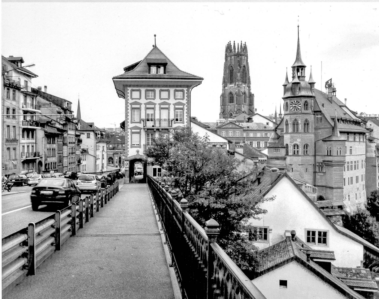
La maison de Schaller et l'Hôtel de ville encadrant la tour de la cathédrale St-Nicolas

meuble, si la niche va avec la statue et si le saint a l'âge de la chaîne d'angle. La lampe-enseigne au-dessus de la Grand-Fontaine parti-