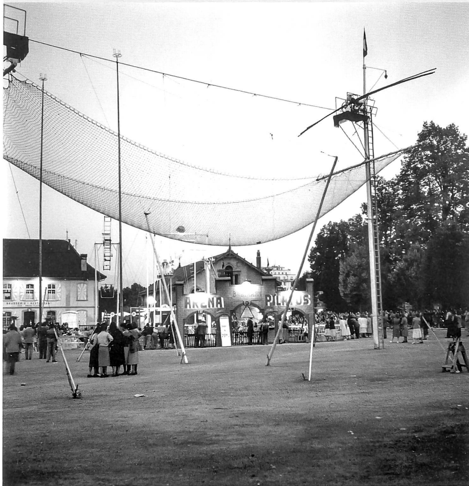
Jour de cirque sur les Grand-Places, dans les années 1950

22 ASBC, Procès-verbal de la réunion convoquée par la Société de développement de Fribourg, du 25 avril 1952. Voir également: Yoki, Que va-t-on construire aux Grands-Places, in: La Liberté, 26 mars 1952 et A. T., Vers un plan général d'urbanisme. Verrons-nous un jour un jardin public aux Grands-Places, in: La Liberté, 26 avril 1952.