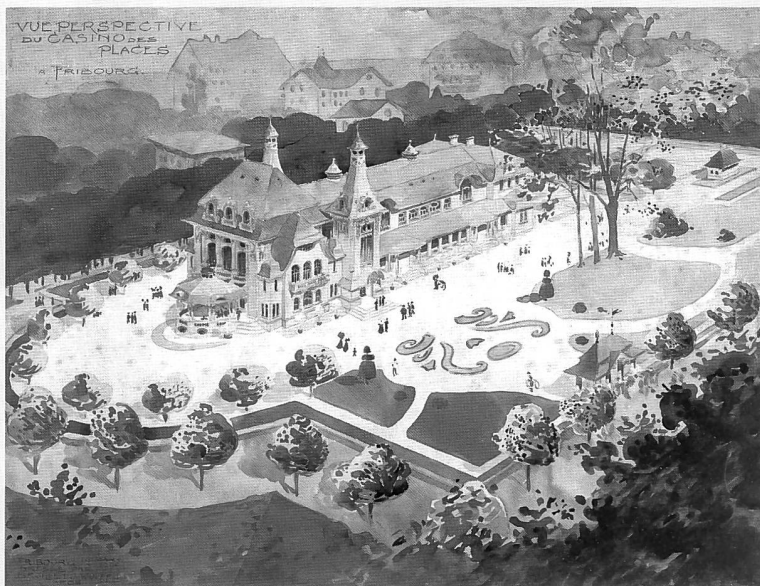
Le casino des Grand-Places, vu par le bureau Broillet & Wulfleff, 12 mars 1906 (AEF)

Construite en 1894-1895 sur les plans de l'architecte Fraisse,