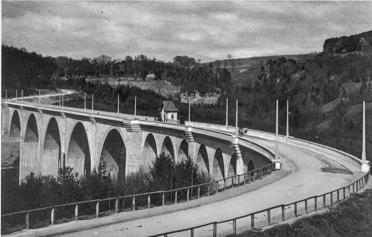
Le pont, au temps des voitures à cheval, peu après son inauguration (Paul Savigny, ASBC, carte postale)

En 1925, Le Corbusier visionnaire évoque la grande ville comme le futur proche d'une société aux moyens décuplés par la mondialisation: «sur les bobines des câbles, il est écrit «France»; sur les locomotives «Leipzig»; sur les pylônes et les coulottes «U.S.A.»; sur les machines électriques «Suisse» et ainsi de suite» 16 . La première partie de l'ouvrage s'achève par trois photos: un gratte-ciel hôtelier de 6'000 chambres, un porte-avion et le pont de Péroles en construction. La modernité du pont réside