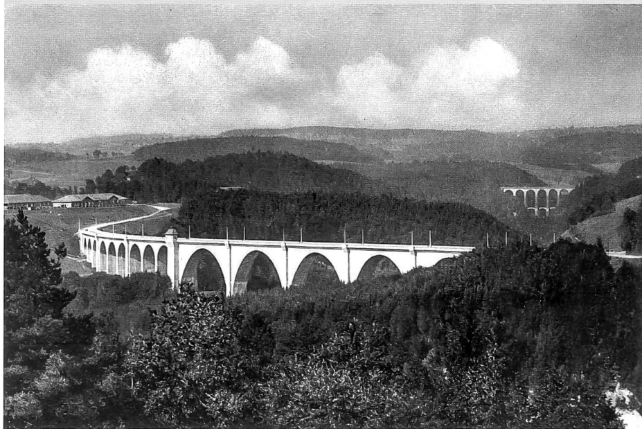
En 1923, les arches du pont de Pérolles et celles du pont de la Glâne (1853-1856), en écho