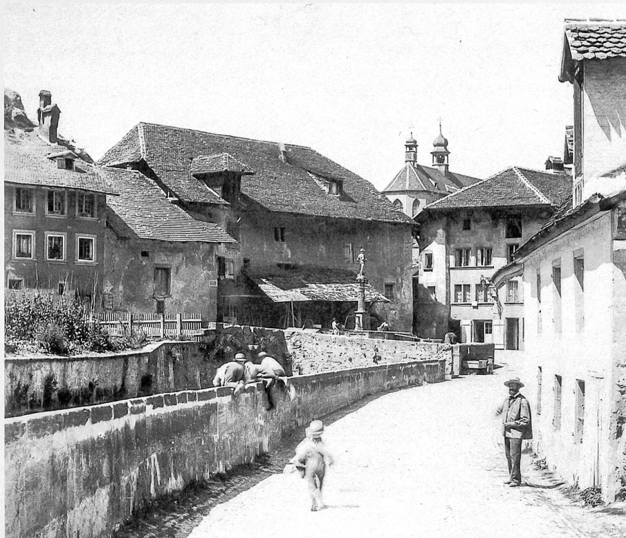
Vue de la porte du Gottéron, la maison Mooses et sa grange-écurie dans les années 1880-1890

«Celui qui visite les habitations du quartier de l'Auge est bien étonné parfois d'y découvrir des pièces d'une dimension qu'atteignent à peine celles des vastes appartements modernes. Les ornements en stuc des plafonds, noircis par le temps, les boiseries richement sculptées dissimulées sous le crépi, la belle ornementation gothique qui se retrouve à la façade extérieure des maisons, témoignage des gloires passées, s'harmonisant peu, hélas! avec les escaliers vermoulus et les débouchés des nombreux logements pratiqués dans les vastes vestibules de la maison d'autrefois. Et ce qui s'ac-