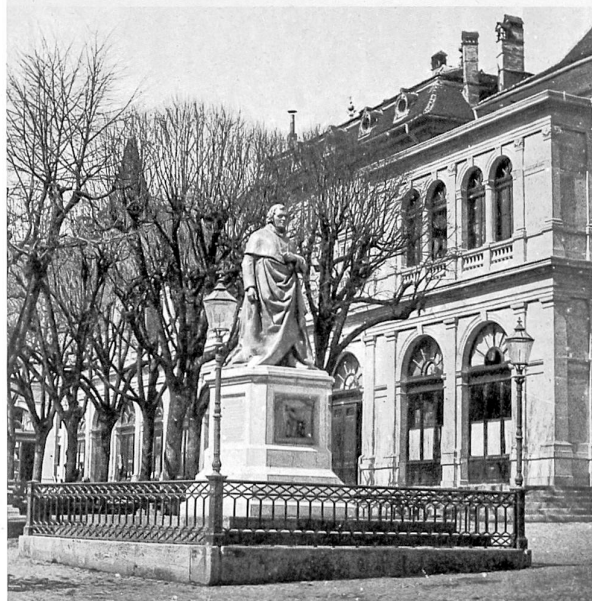
Le monument et sa plateforme peu après leur réalisation, vue stéréoscopique de Pierre-Joseph Rossier, premier photographe connu du canton