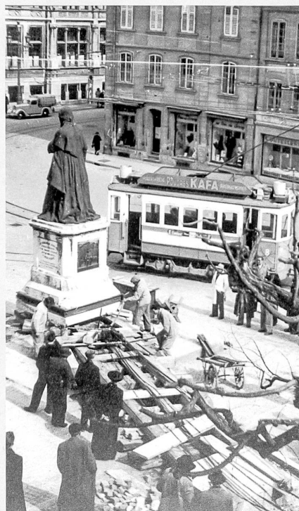
Les ouvriers de François Civelli & Fils à l'action en avril 1951: deux monuments du Vieux Fribourg, sur les rails, font place à l'automobile

11 AEF, Fonds Père Girard, n° 5, 1 er nov. 1851. La crainte d'actes de vandalisme n'était pas injustifiée. En juin 1850, le préfet du district du Lac signala qu'à Fräschels «des individus ont pénétré dans la maison d'école et y ont brisé le portrait du Père Girard, placé là en exécution d'un décret du Grand Conseil» (AEF, Délib. Conseil d'Etat, 3 juin 1850, 382).