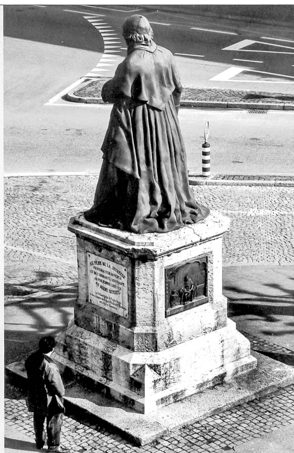
Vue solitaire et trompeuse du monument repoussé en limite de giratoire, depuis le «bletz» au-dessus des Arcades

comme le stipulait le décret du 8 mars 1850, mais posé devant l'école primaire des garçons (rue des Chanoines 1). L'architecte répondit affirmativement et soumit un projet pour un buste dressé sur un piédestal à placer devant la porte médiane de l'école, murée à cet effet. Après examen des divers projets, une majorité de la commission se prononça en faveur du projet Bordereau, évoquant la simplicité de l'exécution «unie à une certaine harmonie morale dans la réalisation de l'idée. Le père est placé à côté de ses enfants; le fondateur et l'architecte de l'Ecole devant son œuvre dont il semble encore défendre et protéger l'existence». Les partisans précisèrent encore que le buste échapperait plus facilement aux dégradations à cet emplacement puisque les «passions politiques et religieuses soulevées peut-être par l'érection d'une statue à cet effet sur une place publique s'apaiseront devant le monument filial pour ainsi dire, élevé au nom de la jeunesse fribourgeoise, à ce père qui lui a rompu la parole de la vie morale et intellectuelle» 11 . Une minorité de la commission regretta cependant que le projet de Bordereau s'écartât du décret du 8 mars qui visait à honorer le Père Girard non seulement comme le «bienfaiteur de la Jeunesse et l'architecte