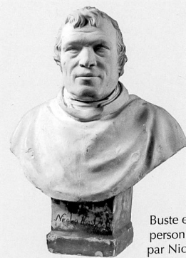
Buste en bronze de la personne par Nic...