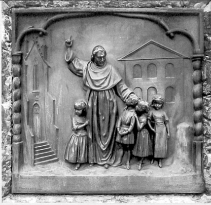
Le pédagogue au milieu de ses élèves, relief en bronze de Raphael Christen, 1861, fondu par F. de Miller, à Munich, 1862

du bâtiment de l'École primaire des garçons de cette ville, mais aussi comme un grand citoyen et l'un des pères de la Patrie. A ce point de vue, la place du monument est marquée sur l'une des places de Fribourg 12 . Les partisans de l'érection d'un monument sur une place publique préférèrent le projet d'Oechslin pour le choix des matériaux et «la noblesse de l'idée» ainsi qu'à cause de la modicité de son prix 13 .