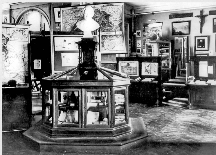
Au centre du Musée pédagogique, la vitrine du Père Girard, l'œuvre d'une vie réunie en mémoire du grand moine éducateur