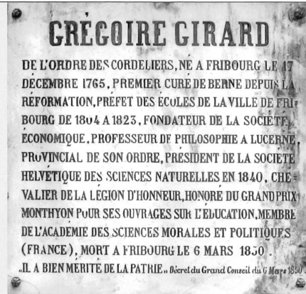
La carte de visite du héros de la patrie, en lettres de bronze sur marbre blanc, insérée sur la face gauche du piédestal