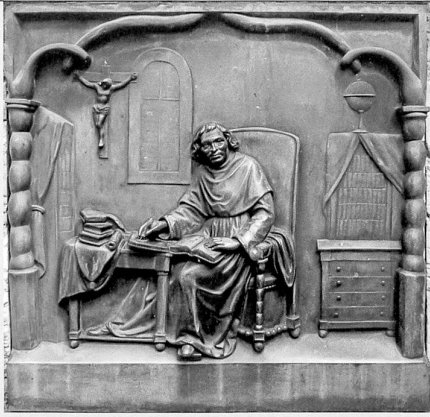
Le pédagogue écrivain, relief en bronze de Raphael Christen, 1861, fondu par F. de Miller, à Munich, 1862

membres apprécièrent pour son effet de ressemblance 17 .