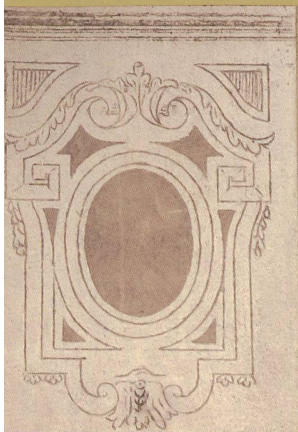
DÉTAILS DU DÉCOR DE SGRAFFITE EN FAÇADE ORIENTALE: UN CARTOUCHE EN GUISE DE CHAPITEAU SUR LES ANGLES, DES TABLES LIANT LES BAIES, DES ENTRELACS ET DES TORES DE LAURIER. ATELIER DEMARTA FRÈRES (?), 1912

D'exécution rapide tout en exigeant de la virtuosité, résistant aux rigueurs du climat, efficace – les motifs étant bien lisibles de loin – ce revêtement mural est en outre bon marché et offre un choix inépuisable de motif adaptés aux moyens ou aux goûts des maîtres d'ouvrage. Les sgraffites de la villa d'Arnold Demarta, probablement réalisés par son entreprise, témoignent d'un savoir-faire qui ne se limitait pas qu'aux fragiles moulages en stuc. Quelle meilleure réclame pour ce nouveau produit que les façades en camaïeu de l'entrepreneur à l'entrée sud de la ville! Pour l'essentiel, le décor de la villa Demarta souligne les articulations architecturales en lieu et place d'éléments traditionnels en stuc: pilastres corniers et chapiteaux, cordons moulurés, frises et corniches, encadrements de baies, panneaux divisant les murs et tables liant les baies. Le répertoire formel est académique: frises de grecques, d'entrelacs et de postes, couronnes et tores de laurier, cartouches. Sous le porche de la maison, une scène bucolique accueille le visiteur. On y voit dans un médaillon un paysan d'âge mur guidant son fils à la charue, dans un paysage préalpin d'où n'émerge que le clocher d'une église. Le motif en tondo est traité comme un tableau dans le tableau. Au premier plan, deux putti, de dos, tenant une faux et un râteau, contemplant la scène tout en ajustant des guirlandes végétales