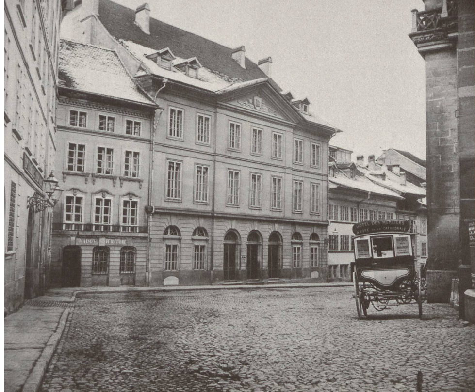
L'HÔTEL DES MERCIERS (DÉMOLI EN 1905), LA MAISON D'HAUTERIVE (DÉMOLI EN 1907), L'ÉCOLE DES GARÇONS ET LA CURE DE SAINT-NICOLAS, VERS 1900

particulières, il avait accès aux manuels les plus connus de l'époque, comme le traité de Jean Rondelet (1743-1829) en sept volumes publiés entre 1802 et 1817, ou celui de Claude-Jacques Toussaint en quatre tomes, publiés en 1811-1812 14 .