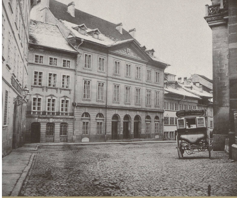
L'HÔTEL DES MERCIERS (DÉMOLI EN 1905), LA MAISON D'HAUTERIVE (DÉMOLI EN 1907), L'ÉCOLE DES GARÇONS ET LA CURE DE SAINT-NICOLAS, VERS 1900

particulières, il avait accès aux manuels les plus connus de l'époque, comme le traité de Jean Rondelet (1743-1829) en sept volumes publiés entre 1802 et 1817, ou celui de Claude-Jacques Toussaint en quatre tomes, publiés en 1811-1812 14 .