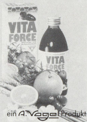
ein A. Vogel Produkt

In der BR Deutschland unter dem Namen «A. Vogels Vitalextrakt» im Handel