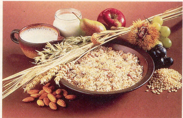
Das tägliche Vollwertmüsli sorgt für ausreichende Versorgung mit Mineralstoffen.

Ein anderer Ratschlag besagt, dass man die Fingernägel täglich 5 Minuten lang in Öl baden