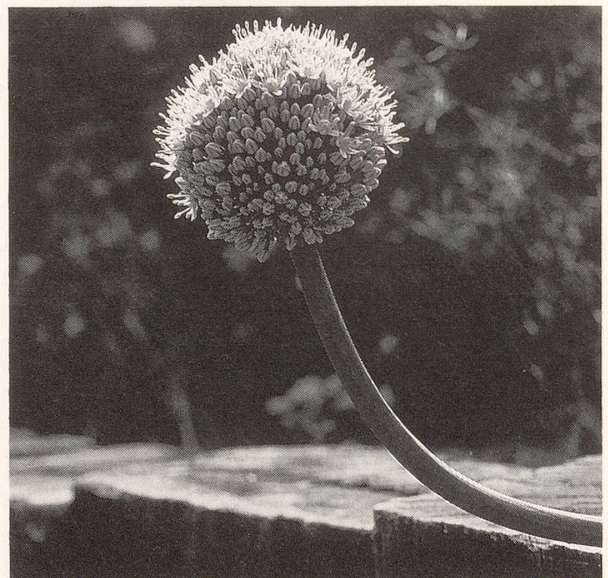
Allium cepa – die blühende Zwiebel, deren Wirkstoffe auch zur Haarpflege dienen.

Der Haarwuchs kann sich jedoch nur dort einstellen, wo die Haarwurzeln noch halbwegs intakt sind und somit noch die Kraft haben, sich zu regenerieren. Urticalcin-Pulver kann man aus Urticalcin-Tabletten selbst herstellen. Sie lassen sich leicht zerkleinern und pulverisieren.