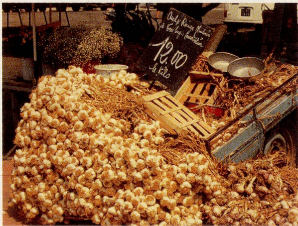
Ein gewohntes Bild: Knoblauchstand in Nizza

Der Knoblauch besitzt ein ätherisches, schwefelhaltiges Öl, das sehr wahrscheinlich an der wurmtreibenden Wirkung des Knoblauchs beteiligt ist. Ein weiteres bekanntes Rezept gegen Würmer ist die Knoblauchmilch. Man zerdrückt zwei roh geraffelte Knoblauchzehen in etwa 1 dl Milch und trinkt diese Medizin. Die Knoblauchmilch wird auch als Klistier verwendet. Statt in Milch oder Olivenöl kann der Knoblauch ausserdem in einer Tasse Wermuttee zerdrückt werden. Schon dieser