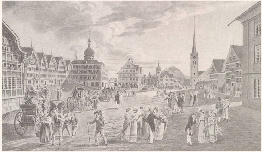
Der Molken Cur-Ort GAIS, Canton Appenzell F. R.

Im 18. Jahrhundert waren Molkenkuren groß in Mode. Gais im Kanton Appenzell Außerrhoden war ein berühmter Molkenkurort.