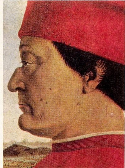
Piero della Francesca, Porträt des Federico da Montefeltro, der sich - eine Seltenheit in der bildenden Kunst - mit seinen kleinen Schönheitsfehlern abbilden ließ.

Uralte suggestive Methoden der Warzenbehandlung sind sicherlich vielen bekannt. Diese Formen des «Wegwünschens» der Warzen sind besonders erfolgreich bei Kindern. Dr. Nacht sieht hinter diesem