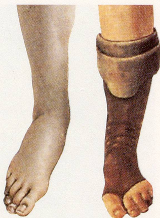
Ein nackter Fuß der Venus und der beschuhte Fuß eines Begleiters der Primavera (Frühling) aus Gemälden von Botticelli.