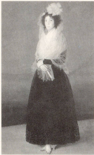
Der Pumps gehört in der Damenmode zum langlebigsten Schuhtyp.