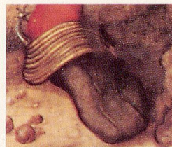
Schuhmode am Hofe des Sonnenkönigs.