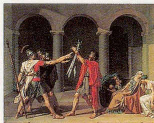
Römische Soldaten mußten keine Hühneraugen befürchten.

wurde, war den Privilegierten eine Sandale gerade recht, die mit kompliziert geflochtenem, bis über den Knöchel reichendem Riemenwerk ausgestattet und bei den Frauen zusätzlich mit Gold und Edelsteinen verziert war. Eine Weiterentwicklung der hochgeschnürten Sandalen war der zehenfreie Stiefel, der, wie beispielsweise auf dem nebenstehenden Gemälde von Jan Massys, eher einem Strumpf glich.