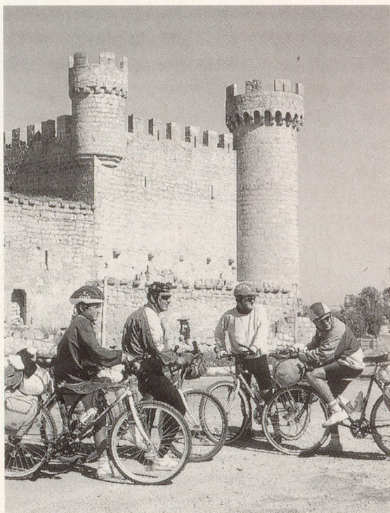
Ferien mit dem Fahrrad – die natürliche Art des Sauerstoff-Tankens.

Nobelpreisträgers Otto Warburg, einem Pionier in Sachen Atmung, fand der Dresdner Physiker Manfred von Ardenne Ende der siebziger Jahre heraus, daß Sauerstoffkonzentrationen, die diejenigen unserer normalen Atemluft übersteigen, den arteriellen Energiestoffwechsel positiv beeinflussen. Die Sauerstoff-Mehrschritt-Therapie, die von Professor von Ardenne entwickelt wurde, ist allerdings bei Medizinern recht umstritten.