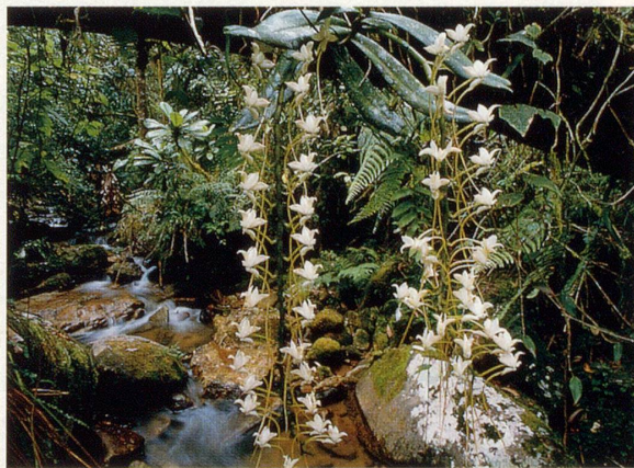
Wildwachsende Orchideen im Regenwald von Madagaskar.

Die meisten unserer einheimischen Orchideen sind sogenannte Erdorchideen , d.h., sie bohren ihre Wurzeln zur Nahrungsaufnahme ins